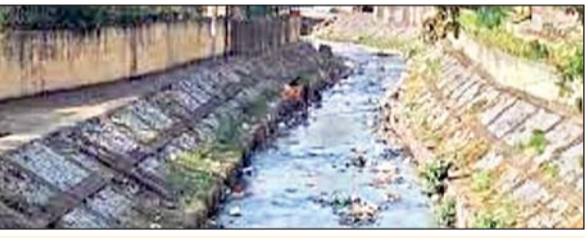
फर्स्ट फेज में 105 करोड़ होगा खर्च वाटर वेज विंग पहले चरण में चार नदियों के संरक्षण पर 105 करोड़ रुपये खर्च किया जायेगा। एक साल में चार नदियों के कैचमेंट एरिया को दर्शाने का काम पूरा होगा है। पहले चरण के तहत नदियों के तहत दोनों तरफ बसावट क्षेत्र में आरसीसी की दीवार भी बनायी जायेगी।

आजाद सिपाही संवाददाता रांची। झारखंड जल संसाधन विभाग अब जलाशयों के अलावा छोटी नदियों को बचाने की योजना पर भी काम करेगा। इसके तहत नदियों के कैचमेंट एरिया और उस एरिया में अतिक्रमण करनेवालों को चिह्नित कर कार्रवाई की जायेगी। वहीं दूसरी तरफ छोटी नदियों को स्थानीय कब्जेधारियों से बचाने के लिए उद्गम स्थल से जिला सीमांकन तक चहारदिवारी की जायेगी। नदियों के कैचमेंट एरिया को आरसीसी पिलर से दर्शाया जायेगा, ताकि उस पिलर के अंदर कोई व्यक्ति कब्जा कर निर्माण कार्य नहीं करे। जल संसाधन विभाग की वाटर वेज विंग रांची के पहले चरण में तीन नदियों के कैचमेंट एरिया की