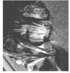
अज्ञात महिला का शव उम्र करीब-50 वर्ष, उंचाई-5 फिट 5 इंच, रंग-सौंवला

उपरोक्त अज्ञात महिला का शव ईटकी थाना अन्तर्गत गोदरेज कम्पनी गोदाम के सामने के पास से बरामद किया गया है। जिसके संबंध में ईटकी थाना-काण्ड सं-05/23, दिनांक-11.12.2023, धारा-279/304(ए) भा0दोवि0 दर्ज किया गया है। इनकी पहचान हेतु जनता का सहयोग अपेक्षित है। इनकी पहचान हेतु जनता का सहयोग अपेक्षित है।