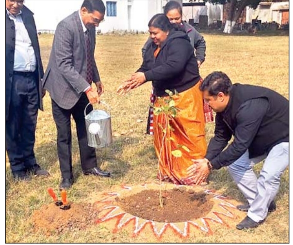
सीवरेज और पानी की लाइनों की सफाई की गयी। इस अभियान के अंतर्गत आवासीय कॉलोनीयों और आसपास के गांवों में रसोई से निकालनेवाले अपशिष्ट जल की रिसाइक्लिंग और जल संचयन के बारे में जागरूकता पैदा की गयी। प्लास्टिक कचरे के प्रबंधन, जैविक कचरे के उपयोग और