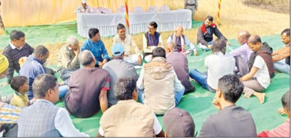
ग्रामीणों के साथ कर उनकी समस्याएं सुनते रांची के सांसद संजय सेठ।

नामकुम। रांची सांसद संजय सेठ ने शुक्रवार को महिलौंग पंचायत के महिलौंग गांव में पार्टी कार्यकर्ताओं व ग्रामीणों के साथ बैठक कर उनकी समस्याएं सुनी। सर्वप्रथम ग्रामीणों ने सांसद का फूल माला पहनाकर स्वागत किया। बैठक में ग्रामीणों ने सांसद के समक्ष रेलवे लाइन में अंडर पास, स्वर्णरेखा नदी में श्मशान घाट तक जाने वाली सड़क एवं पुल निर्माण, स्वर्णरेखा नदी में चैक डेम एवं सिंचाई के लिये पाइप-लाइन लगाने, बड़कुंबा में हौरहाप के बांग्ला टोली से बिनहोर बेटा तक करीब दो किलोमीटर पथ एवं हौरहाप नदी में पुल निर्माण, रेलवे पुल से नगड़ा टोली तक गडवाल निर्माण, रिंग रोड में सरना स्थल एवं वन विभाग के पास अंडर पास निर्माण की समस्या रखी। इस पर सांसद ने