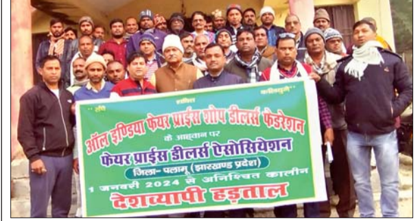
हुसैनाबाद (आजाद सिपाही)।