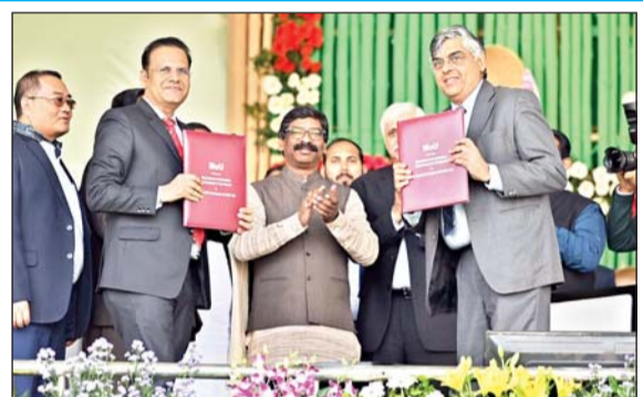
307 मेडिकल अफसर और कर्मियों एवं शिक्षा विभाग में पीजीटी टीचर तथा लैब असिस्टेंट के लिए चयनित 662 अभ्यर्थियों को नियुक्ति पत्र प्रदान किया।

सरकार के चार साल पूरे होने पर रांची में आयोजित राज्य स्तरीय समारोह में मुख्यमंत्री ने 849.37 करोड़ की लागत वाली 20 विकास योजनाओं का लोकार्पण किया। जिन महत्वपूर्ण योजनाओं का उद्घाटन हुआ, उसमें रांची स्मार्ट सिटी के एरिया वेस्ट डेवलपमेंट के तहत इंटीग्रेटेड इंफ्रास्ट्रक्चर का विकास कार्य और खूटी के करम में औद्योगिक प्रशिक्षण संस्थान शामिल हैं। मुख्यमंत्री ने इस अवसर पर स्वास्थ्य विभाग में नव चयनित