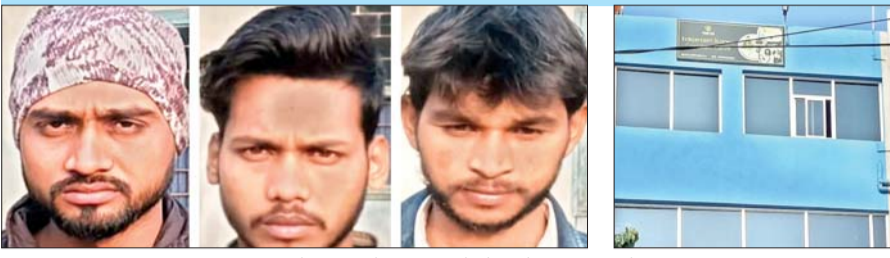
पुलिस की गिरफ्त में तीन आरोपित व रातू के टेंडर में संचालित ठगों का दफ्तर।