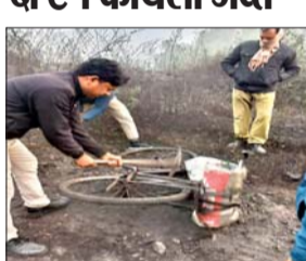
जांरंगडीह ।