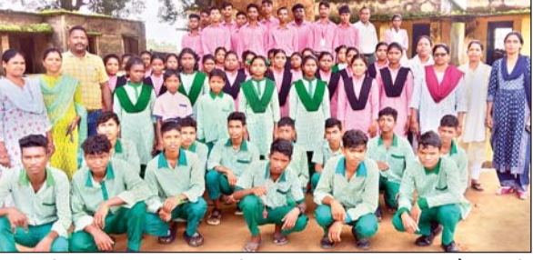
स्कूल ड्रेस पहन कर सीटी बजाते हुए स्कूल जाते हैं, जिससे अभिभावकों को यह पता चल जाता है कि स्कूल खुला है और उन्हें अपने बच्चों को भी स्कूल भेजना है। सीटी ग्रामीण इलाकों में

आजाद सिपाही संवाददाता रांची। सिमडेगा जिले के सरकारी स्कूलों में बच्चों की उपस्थिति शत प्रतिशत करने और उनकी उपस्थिति बढ़ाने के उद्देश्य से शुरू किये गये अनोखे सीटी बजाओ-उपस्थिति बढ़ाओ अभियान का असर दिख रहा है। इस अभियान से ना केवल स्कूलों में बच्चों की उपस्थिति बढ़ रही है, बल्कि बच्चों में नेतृत्व क्षमता का भी विकास हो रहा है। सुबह आठ बजे स्कूल जाने के दौरान गांव-टोले में एक-एक मॉनिटर के नेतृत्व में स्कूली बच्चे