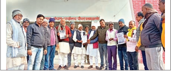
पीडीएस दुकानदार हाथ में तख्तियां लेकर पहुंचे पीपरा ब्लॉक।

विश्रामपुर/हरिहरगंज (पलामू)। ऑल इंडिया फेयर प्राइस शॉप डीलर्स फेडरेशन के आह्वान पर विश्रामपुर, पांडू, नावा बाजार व उंटारी रोड प्रखंड के सभी पीडीएस डीलरों ने अपनी विभिन्न मांगों के समर्थन में दुकानें बंद रखने का निर्णय लिया है। विश्रामपुर प्रखंड के डीलरों ने मांगों के समर्थन में रविवार को प्रखंड कार्यालय के समक्ष प्रदर्शन किया। इस दौरान अपनी-अपनी दुकानें सोमवार से बंद रखने की घोषणा की। इसके अलावा डीलरों