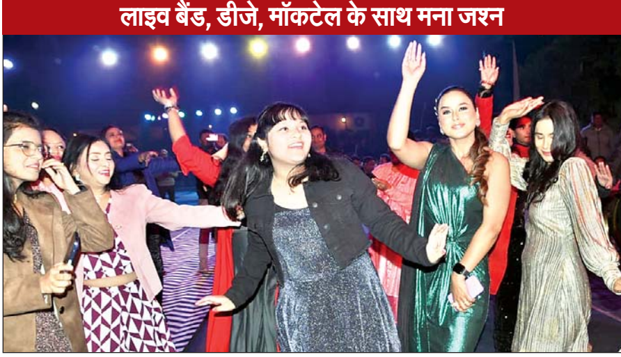
लाइव बैंड, डीजे, मॉकटेल के साथ मना जश्न

राजधानी रांची में लाइव बैंड, डीजे, मॉकटेल और आतिशबाजी के साथ होगा न्यू इयर 2024 के स्वागत को राजधानी रांची तैयार थी। अनलिमिटेड ट्रिंक, लजीज व्यंजन के साथ, रशियन बेले