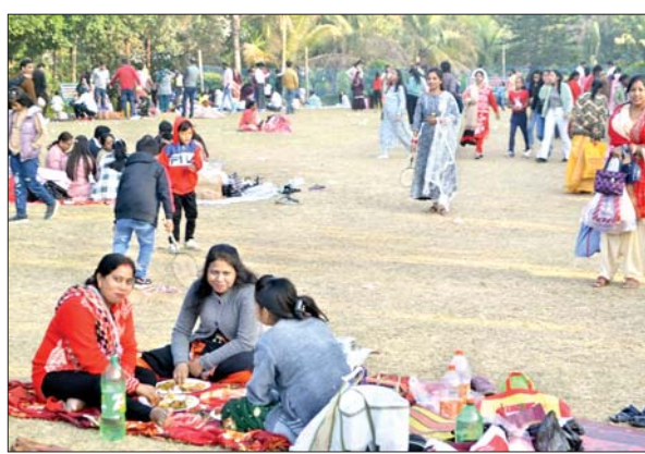
पिकनिक स्थल पर समूह बनाकर नव वर्ष का लुत्फ उठाते लोग।