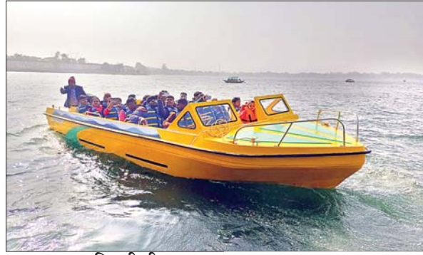
आजाद सिपाही टीम

धनबाद। नव वर्ष 2024 का स्वागत सोमवार को कोयलांचलवासियों ने अपने-अपने तरीके अंजाद में किया। कहीं रंगारंग कार्यक्रम आयोजित हुआ, तो कहीं धार्मिक अनुष्ठान आयोजित कर लोगों ने मंगलमय जीवन की कामना की। जिले के सभी पिकनिक स्पॉट सहित प्रमुख धार्मिक स्थलों पर सुबह से ही लोगों की भारी भीड़ जुटी रही। यह सिलसिला देर शाम तक चला। इस दौरान सुरक्षा के लिहाज से जिला प्रशासन की मुस्तैदी भी देखी।