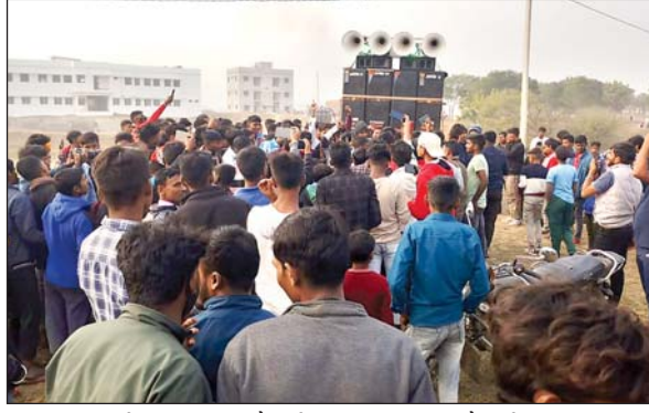
चहारादीवारी के अंदर भी सैकड़ों की संख्या में पिकनिक मनाने वालों की टोली देखी गयी। सतबहिनी झरना तीर्थ के एरिया के बाहर भी सैकड़ों की संख्या पिकनिक टोली पिकनिक आनंद लिया। सतबहिनी झरना तीर्थ स्थित सभी मंदिरों में पूजा

कांडी। प्रखंड के प्रसिद्ध झरना तीर्थ में नववर्ष मनाने वालों की काफी भीड़ देखी गयी। सुबह से मौसम खराब होने के कारण सैलानियों की संख्या में कमी थी। लेकिन दोपहर 12 बजे के बाद मौसम कुछ ठीक होने के बाद पिकनिक मनाने वाले सैलानियों की भीड़ सतबहिनी आने लगे। दोपहिया, चार पहिया और जिसके पास जो साधन उपलब्ध था। लोग अपने ईस्ट मित्र के साथ व अपने परिवार के साथ पिकनिक मनाने सतबहिनी झरना तीर्थ पहुंचे। सतबहिनी झरना तीर्थ के निश्चित