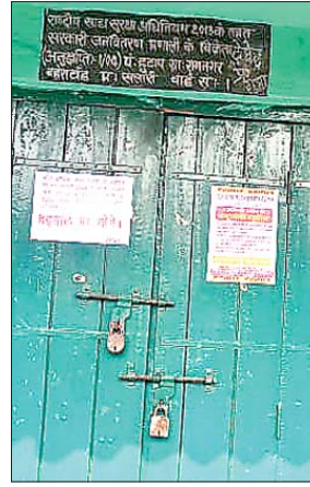
हुआ है। पीडीएस राशन डीलरों ने

खलारी। एक जनवरी से लगातार चौथे दिन भी हड़ताल पर है खलारी के पीडीएस राशन डीलर। ऑल इंडिया फेयर प्राइश शॉप फेडरेशन की झारखंड इकाई एवं फेयर प्राइश शॉप डीलर्स एसोसिएशन रांची जिला के निर्देश पर खलारी, डकरा एवं मैकलुस्कीगंज क्षेत्र के कुल 61 पीडीएस राशन डीलर हड़ताल पर हैं। हड़ताल के कारण राशन का उठाव एवं वितरण पूरी तरह से ठंड है। सभी राशन पीडीएस डीलर के दुकानों पर ताला लटका