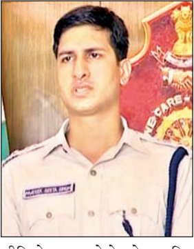
वीडियो या फोटो के जरिए अफवाह फैलाने से ज्यादा लोग प्रभावित होंगे। इसलिए पुलिस इससे कैसे निपटेगी इस पर एक कार्यशाला आयोजित की गयी है,

भुवनेश्वर। आम चुनाव आ रहे हैं। सोशल मीडिया पर राजनेताओं की डीप फेक तस्वीरें और वीडियो घूम सका है। डीप फेक वीडियो और फोटो को लेकर कमिश्नर पुलिस के लिए चुनौती बढ़ती जा रही है। कैसे पहचानें कि कौन सा सच है और कौन सा झूठ? कौन सी फोटो या वीडियो असली है या नकली? इसके लिए कमिश्नर पुलिस साइबर विशेषज्ञों से प्रशिक्षण ले रहे हैं। राजनीतिक हिंसा से ज्यादा डीप फेक वीडियो पुलिस के लिए चिंता का विषय है। क्योंकि सोशल मीडिया पर फर्जी