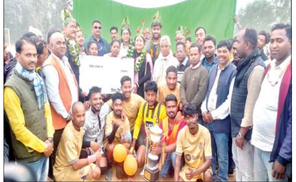
विजेता कप के साथ ओरमांझी फुटबॉल क्लब के सदस्य व गणमान्य लोग।