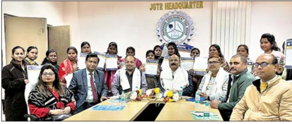
प्रशिक्षण कार्यक्रम में उपस्थित गणमान्या लोग और प्रशिक्षु।