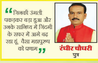
“जिनकी उंगली पकड़कर बड़ा हुआ और उनके सानिध्य में जिनकी के सफर में आगे बढ़ रहा हूँ, वैसा महापुरुष को प्रणाम”