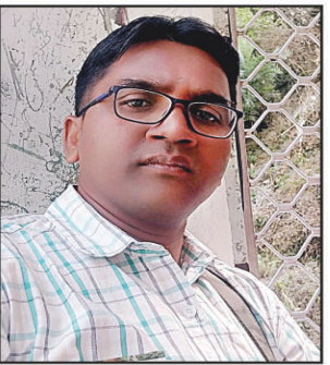
मनोरंजन प्रसाद विभागाध्यक्ष आर.टी.सी. बी.एड. कॉलेज, बुटी