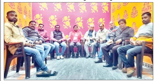
महाजुटान को लेकर बैठक करते भाजपाई।

नामकुम (आजाद सिपाही)। भाजपा अनुसूचित जाति मोर्चा का सात जनवरी को होने वाले महाजुटान कार्यक्रम को लेकर शुक्रवार को नामकुम के चटकपुर में बैठक की गई। जिसमें बताया गया कि यह कार्यक्रम नामकुम प्रखंड के चटकपुर में आयोजित होगी। जिसमें मुख्य अतिथि के रूप में पूर्व मुख्यमंत्री सह भाजपा प्रदेश अध्यक्ष बाबुलाल मरांडी एवं भाजपा विधायक दल के नेता