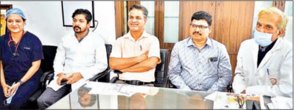
आजाद सिपाही संवाददाता

भुवनेश्वर। इंस्टीट्यूट ऑफ मेडिकल साइंसेज एंड सम हॉस्पिटल्स के सर्जन द्वारा नवजात शिशु के शरीर के निचले हिस्से से जुड़े सिर के आकार के द्यूमर को एक सफल सर्जरी के माध्यम से हटा दिया गया और बच्चे को नया जीवन दिया गया। खोरधा क्षेत्र के एक दंपति के बच्चे के जन्म के समय उनके मलाशय में सिर के आकार का द्यूमर पाया गया था। द्यूमर, जो सिर की गांठ के समान है, उस पर त्वचा, कान और बाल भी पाए गये। ऐसी स्थिति देखकर बच्चे के परिजन उसे सम हॉस्पिटल ले आये। नवजात बाल