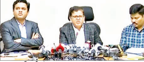
आजाद सिपाही संवाददाता

12 लाख 97 हजार 954 नये मतदाता 2024 में करेंगे मतदान मतदाताओं की संख्या तीन करोड़ 32 लाख है : निर्वाचन आयोग