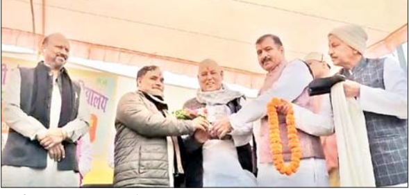
कार्यक्रम का उद्घाटन करते, पलामू सांसद, स्थानीय विधायक व अन्य।