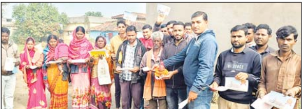
शुरू किया गया।

सगमा। वर्षों की तपस्या, संघर्ष और प्रतीक्षा के फलस्वरूप अयोध्या धाम में बने वाले श्री राम मंदिर में आगामी 22 जनवरी 2024 को प्रभु श्री राम के मूर्त रूप का प्राण प्रतिष्ठा होना सुनिश्चित हुआ है। इस पवित्र क्षण का साक्षी बनने हेतु श्री राम जन्मभूमि तीर्थ क्षेत्र न्यास के द्वारा देश के सभी सनातनियों को अर्च्छत और पत्रक विश्व हिंदू परिषद के तत्वाधान में पूरे प्रखंड में अयोध्या से आई पूजित अक्षत का वितरण कार्य