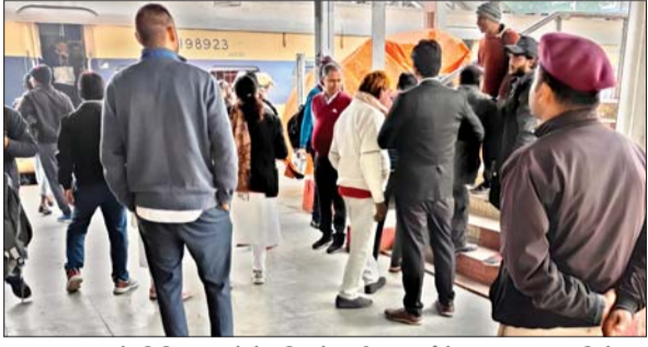
धनबाद मंडल के विभिन्न खंडों में मजिस्ट्रेट की अगुवाई में चलाया जा रहा विशेष जांच अभियान।

धनबाद। धनबाद मंडल में रविवार को धनबाद से कोडरमा खंड के बीच विशेष टिकट जांच अभियान चलाया। जिसकी अगुवाई मजिस्ट्रेट ने की। इस दौरान विभिन्न खंडों धनबाद, गोमो, कोडरमा, डाल्टनगंज, चोपन, बरकाकाना, सिंगरौली स्टेशनों में गहन टिकट जांच की गयी। मजिस्ट्रेट टिकट जांच के दौरान मुख्य वाणिज्य निरीक्षक/टिकट आरपीएफ के जवानों को लगाया गया था। इस दौरान कुल 300 यात्रियों को पकड़ा गया एवं उनसे एक लाख 26 हजार 920 रुपये