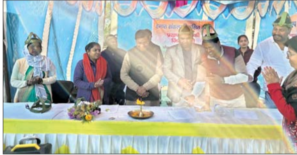
कार्यक्रम को संबोधित करते सांसद सुदर्शन भगत।

इटकी। इटकी पूर्वी पंचायत सचिवालय प्रांगण में शुक्रवार को हमारा संकल्प विकसित भारत कार्यक्रम का आयोजन किया गया। जिसमें बतौर मुख्य अतिथि के रूप में सांसद सुदर्शन भगत शामिल हुए। उन्होंने द्वीप प्रज्वलित कर कार्यक्रम की शुरुआत की। सांसद ने लोगों को विकसित और मजबूत भारत निर्माण के लिए आगे आने और भागीदार बनने का आह्वान