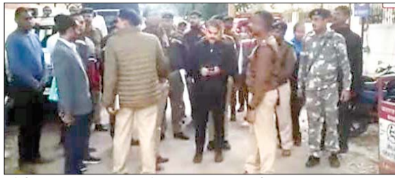
कोर्ट परिसर का निरीक्षण करते एसएसपी एचपी जनार्दन व अन्य।

धनबाद। एसएसपी एचपी जनार्दन ने कोर्ट परिसर में सुरक्षा का जायजा लेते हुए यहां लगने वाले वाहनों की पार्किंग स्थल के साथ ही कोर्ट परिसर में दाखिल होने के सभी रास्तों को बारीकी से अध्ययन किया। एसएसपी ने बताया कि हाइकोर्ट के निर्देश पर सुरक्षा की दृष्टिकोण से कोर्ट परिसर का निरीक्षण किया गया है। कोर्ट परिसर में दो दरवाजे हैं, जहां