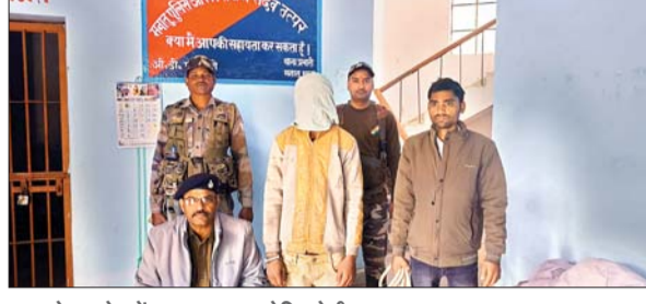
हत्या के आरोप में पकड़ा गया आरोपित प्रेमी।