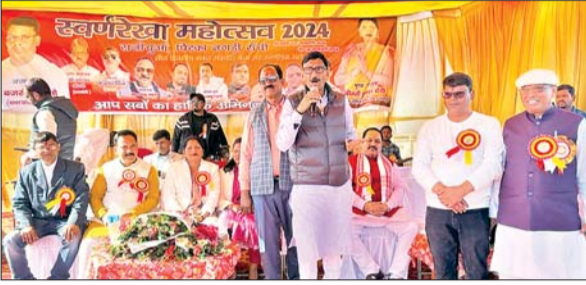
स्वर्णरेखा महोत्सव 2024 सह मकर संक्रांति मेला को संबोधित करते सांसद संजय सेठ व अन्य।