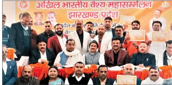
को उचित प्रतिनिधित्व सहित कई समस्याओं से अवगत कराया। ओबीसी के 27 फीसदी आरक्षण, सहित राज्य में ओबीसी वर्ग पर हो रहे अत्याचार पर विस्तृत रूप से चर्चा हुई। बैठक को संबोधित

मेदिनीनगर (आजाद सिपाही)। अखिल भारतीय वैश्य महासम्मेलन झारखंड की पहली प्रदेश कार्य समिति की बैठक दिवांबर जैन धर्मशाला में संपन्न हुई। जिसमें राज्य भर के 24 जिलों के प्रतिनिधि शामिल हुए। बैठक में नवनिर्वाचित पदाधिकारी को परिचय के साथ बैठक की शुरुआत हुई। इसके बाद सभी जिलों के पदाधिकारी ने संगठन की मजबूती पर बल देते हुए अति शीघ्र सभी जिलों की कमेटी गठित कर प्रदेश को सौंपने की बात कही साथ ही सभी पदाधिकारी ने वैश्य समाज