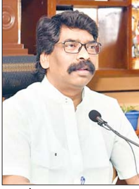
चुका है। तीन कमरों का मकान बनवाया जायेगा : अबुआ आवास योजना

आजाद सिपाही संवाददाता रांची। मुख्यमंत्री हेमंत सोरेन मंगलवार को अबुआ आवास योजना की पहली किस्त जारी करेंगे। खूंट्टी के तोरपा से सीएम पहली किस्त जारी करेंगे। तोरपा से सीएम राज्यभर के अबुआ आवास योजना के लाभुकों को डीबीटी के माध्यम से पैसा ट्रांसफर करेंगे। सीएम के तोरपा दौरे को लेकर तैयारियां पूरी हो चुकी हैं। अबुआ आवास के लिए 31 लाख से अधिक आवेदन मिले हैं। उसमें से 29.97 लाख आवेदनों का सत्यापन किया जा