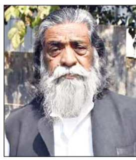
कार्रवाई पर लगी रोक भी हट गयी है। दिल्ली हाइकोर्ट के इस फैसले से शिबू सोरेन को बड़ा झटका लगा है। हाइकोर्ट से याचिका

आजाद सिपाही संवाददाता रांची। दिल्ली हाइकोर्ट ने झामुमो के अध्यक्ष शिबू सोरेन से जुड़े लोकपाल मामले में फैसला सुना दिया है। इस मामले से जुड़े सभी पक्षों की पूरी बहस सुनने के बाद अदालत ने 22 सितंबर को फैसला सुनिश्चित रख लिया था। दिल्ली हाइकोर्ट ने फैसला सुनाते हुए शिबू सोरेन की याचिका खारिज कर दी। याचिका खारिज होने के साथ ही आय से अधिक संपत्ति मामले में शिबू सोरेन के खिलाफ लोकपाल के सामने