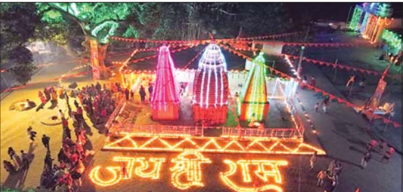
राम के उल्लास में युवा वर्ग घंटों भजन कीर्तन में झूमता रहा आजाद सिपाही संवाददाता

बेड़ो। श्रीराम जन्मभूमि मंदिर में रामलला की प्राण प्रतिष्ठा के अवसर पर बेड़ो में श्रद्धा, उल्लास और भक्ति का जनसेलाब उमड़ा। राम के उल्लास में युवा वर्ग घंटों जुलूस व भजन कीर्तन में झूमता रहा। लोगों ने जय श्रीराम व शिया राम जय जय राम के गगनचुंबी नारे लगाए। गांव से आये जुलूस