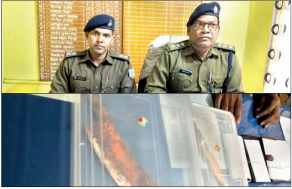
हत्या में इस्तेमाल हथियार व घटना की जानकारी देती महुदा पुलिस।