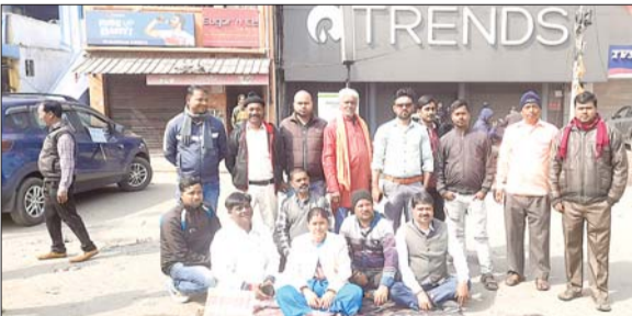
सड़क जाम कर विरोध प्रदर्शन करते विभिन्न राजनीतिक दलों के लोग।