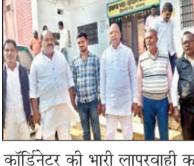
काॅर्डिनेटर की भारी लापरवाही का भी आरोप लगाया है। मंगलवार

आजाद सिपाही संवाददाता उंटारी रोड (पलामू)। जिले के उंटारी रोड प्रखंड क्षेत्र में अबुआ आवास में बरती जा रही अनियमितता को लेकर माहौल गरम है। मुखिया संघ ने आरोप लगाते हुए बताया कि ग्राम सभा में पारित सूची से जियो टैग नहीं किया जा रहा है। संघ ने आवास