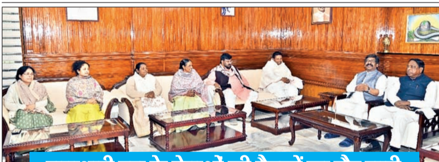
सत्ताधारी दल के नेताओं की बैठकों का दौर जारी

■ राज्य में सियासी हलचल तेज, बैठकों का दौर जारी