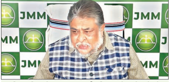
आखिर दिल्ली आवास पर कैसे पहुंची इडी की टीम