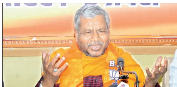
आजाद सिपाही संवाददाता

भ्रष्टाचार के खिलाफ संघर्ष जारी, भ्रष्टाचारियों को अंतिम मुकाम तक पहुंचा कर ही दम लेंगे