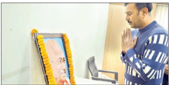
महात्मा गांधी को श्रद्धांजलि अर्पित की