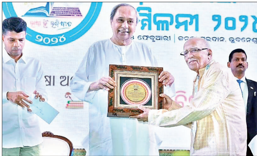
भाषा सम्मेलन में उड़िया भाषा प्रमुखता प्राप्त कर रही है। ए.से.एल.अक्षर उड़िया भाषा का परिचय दिया है। अतीत, वर्तमान और भविष्य को दर्शाता है। उड़िया भाषा और लिपि की उत्पत्ति और विकास को प्राचीन प्रस्तर के शिलालेखों, तबि की प्लेटों, ताड़ के पत्तों, पोथी, कलिंग शैली की मंदिर वास्तुकला और ओड़िशा के समुद्री व्यापार से संबंधित कलाकृतियों के सुंदर चित्रों के

भुवनेश्वर। बंदे उत्कल जननी गीत के गायन के साथ उड़िया भाषा की आन-बान और शान उड़िया भाषा महोत्सव की शुरुआत किया गया। शनिवार को प्रथम विश्व ओड़िशा भाषा सम्मेलन का आयोजन जनता मैदान, भुवनेश्वर में किया गया। मुख्यमंत्री नवीन पटनायक ने उड़िया भाषा जगत के कई प्रतिष्ठित लेखकों, साहित्यकारों और कवियों की उपस्थिति में इस भाषा महाकुंभ का शुभारंभ किया। इसके साथ उड़िया भाषा के इतिहास में एक नया अध्याय जुड़ गया है।