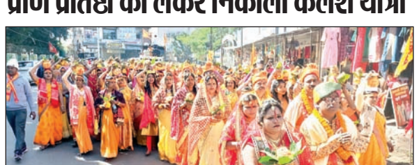
लोहरदगा (आजाद सिपाही)