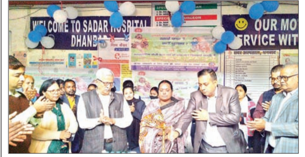
दवा की खुराक खिलाकर अभियान का शुभारंभ करते सिविल सर्जन, जिला अध्यक्ष व अन्य।

- जिला अध्यक्ष व एडीएम ने दवा खाकर किया फाइलेरिया उन्मूलन कार्यक्रम का शुभारंभ - 2220 बूथ पर 26 लाख से अधिक लोगों को दवा खिलाने का लक्ष्य : सिविल सर्जन