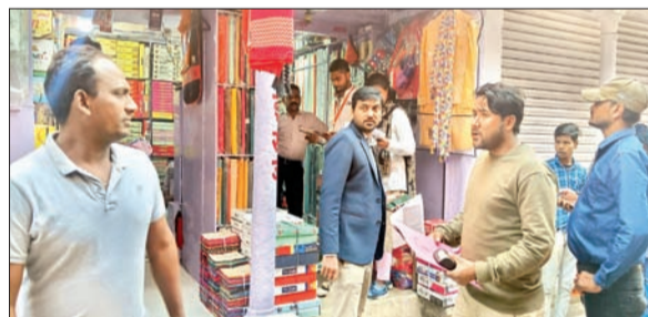
अभियान चलाते कार्यपालक पदाधिकारी व नपं कर्मी।

13 व्यवसायियों से वसूला 36 हजार जुर्माना