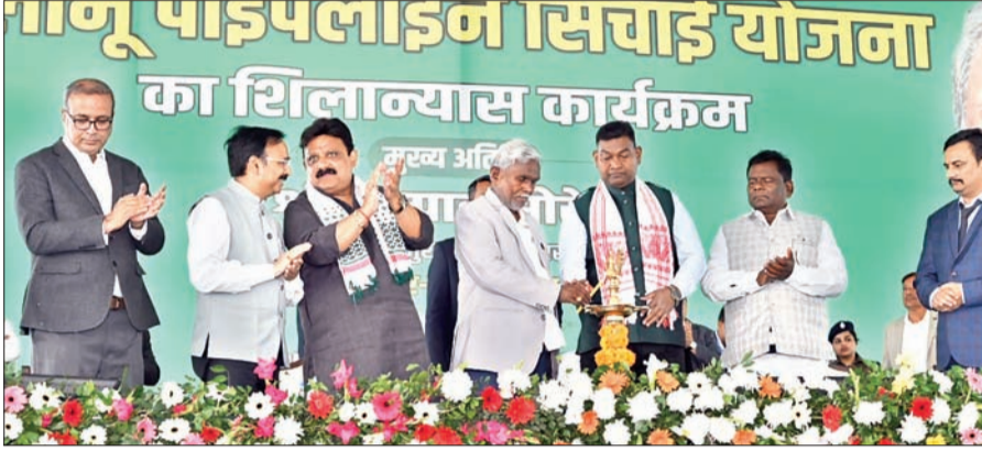
पलामू पाइपलाइन सिंचाई योजना कार्यक्रम का शुभारंभ करते मुख्यमंत्री चंपाई सोरेन, मंत्री सत्यानंद भोक्ता व अन्य।

गया। मुख्यमंत्री ने बताया कि राज्य के 20 लाख से अधिक गरीब परिवारों को अबुआ आवास योजना से जोड़ा गया है। लक्ष्य के अनुरूप वर्ष 2027 तक सभी चर्चनित परिवारों को अबुआ आवास योजना का लाभ दिया जाएगा। वहीं, मंत्री सत्यानंद भोक्ता