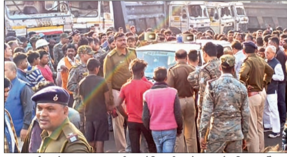
सड़क दुर्घटना के बाद हंगामा करती आक्रोशित भीड़ को समझाते पुलिस कर्मी।

छोटी बहन को स्कूल छोड़कर घर लौटने के दौरान हुआ हादसा, पुलिस के समझाने व वार्ता के आशवासन के बाद आठ घंटे बाद हटाया गया जाम आजाद सिपाही संवाददाता