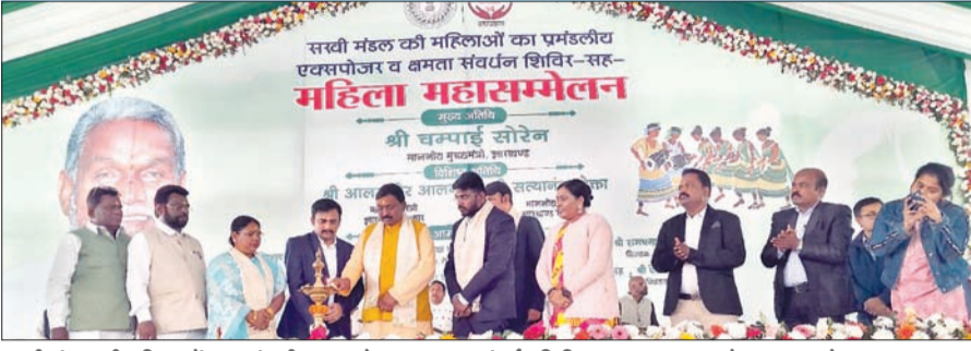
सखी मंडल की महिलाओं का प्रमंडलीय एक्सपोजर व क्षमता संवर्धन शिविर का उद्घाटन करते गणमान्य लोग।