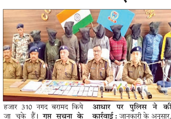
हजार 310 नगद बरामद किये जा चुके हैं। गुप्त सूचना के