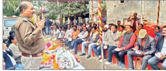
शांति समिति के सदस्यों के साथ बैठक करते थाना प्रभारी।