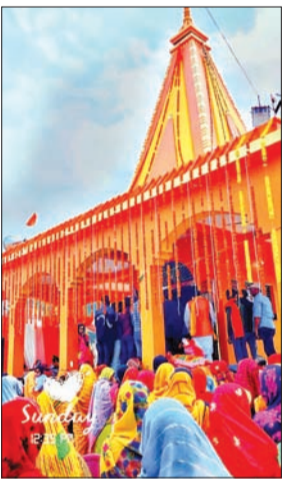
नव निर्मित महावीर मंदिर में उमड़ी श्रद्धालुओं की भारी भीड़।