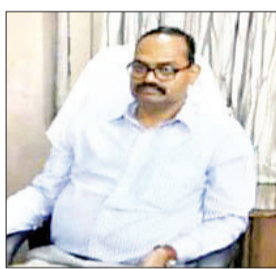
कुछ लोग पकड़ भी जा चुके हैं,

धनबाद। कोयलांचल धनबाद में शराब की अधिकांश दुकानों में प्रिंट रेट से 20 से 40 रुपये तक की अवैध वसूली की जा रही है। यही नहीं, दुकानों में ही नकली शराब भी बनाए जा रहे हैं, जिसे लेकर विगत दिनों उत्पाद विभाग की ओर से कार्रवाई भी की गई है।