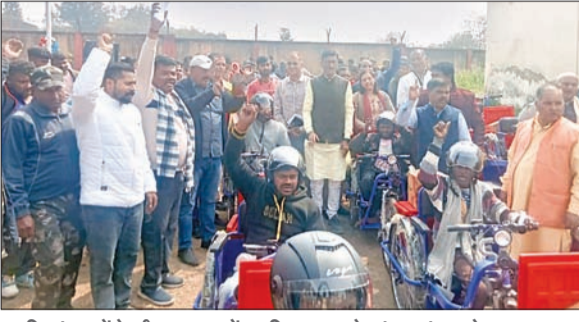
दिव्यांगजनों के बीच उपकरणों का वितरण करते सांसद संजय सेठ व अन्य।