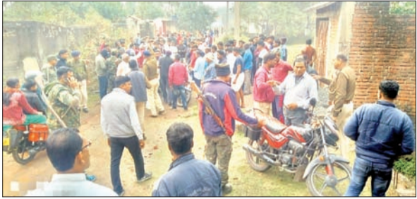
हंगामा कर रहे लोगों को समझाने का प्रयास करती पुलिस।

आजाद सिपाही संवाददाता निरसा। थाना क्षेत्र के खुसरी मोड़ पर मामूली विवाद को लेकर दो समुदायों के बीच हिंसक झड़प होने का मामला प्रकाश में आया है। इस दौरान दोनों ओर से एक-दूसरे पर ईट-पत्थरबाजी की गई जिसमें कई लोग घायल हो गए। घायलों में स्कूली बच्चे भी शामिल हैं। हालांकि इसकी सूचना पाकर समय रहते निरसा पुलिस पहुंच गई और स्थानीय प्रबुद्ध लोगों की मदद से मामले को शांत कराया। जानकर के अनुसार गुरुवार को