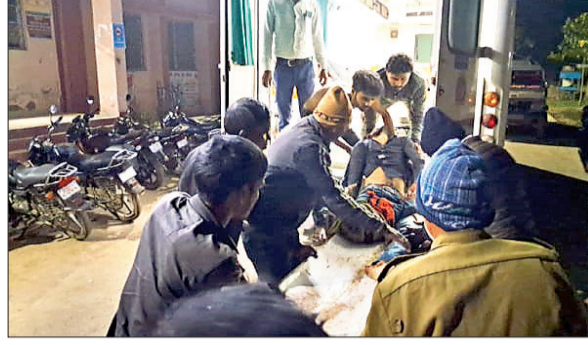
घायल युवक का इलाज करते चिकित्सक।