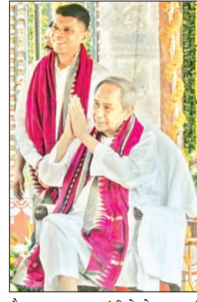
है। इस पर मुख्यमंत्री ने बेहद खुशी जताते हुए कहा कि यह कंपनी निवेश और रोजगार के मामले में ओड़िशा की नयी पहचान बनायेगी।