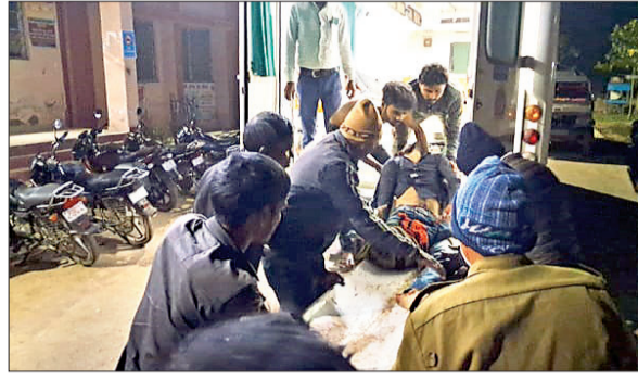
घायल युवक का इलाज करते चिकित्सक।