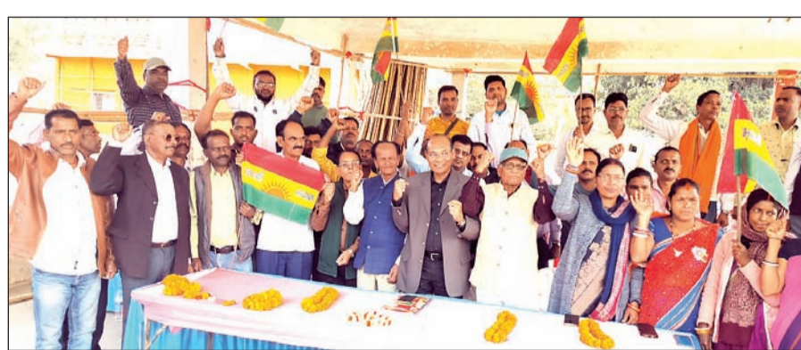
महादानी मैदान बेड़ों के रंगमंच पर मूलवासी सदान मोर्चा की बैठक में एकजुटता दिखाते सदान समुदाय।

मूलवासी सदान मोर्चा की आगामी 27 फरवरी को रांची में होने वाली अधिकार मार्च की तैयारी को बेड़ों में हुआ बैठक का आयोजन