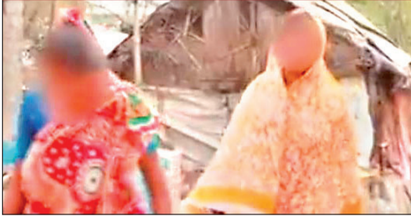
संदेशखाली की पीड़ित महिलाएं (वीडियो से ली गयी तस्वीर)

प्रधानमंत्री जा सकते हैं पीड़ितों से मिलने