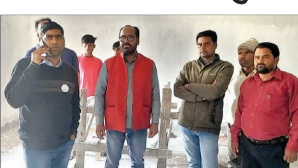
घटिया निर्माण की जांच करने पहुंचे सदर बीडीओ व अन्य।