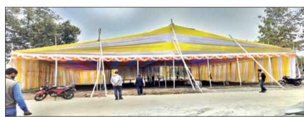
उद्घाटन-शिलान्यास कार्यक्रम को लेकर बनाया जा रहा पंढाल।