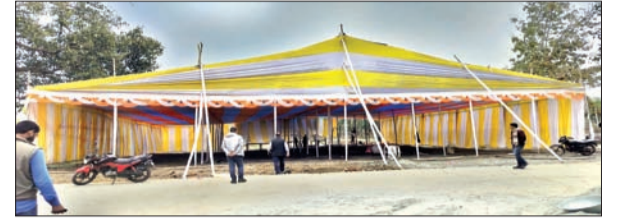
उद्घाटन-शिलान्यास कार्यक्रम को लेकर बनाया जा रहा पंडाल।