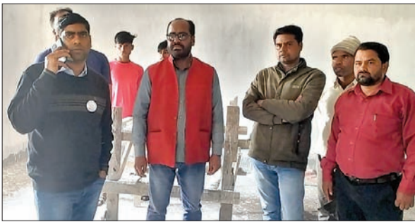
घटिया निर्माण की जांच करने पहुंचे सदर बीडीओ व अन्य।