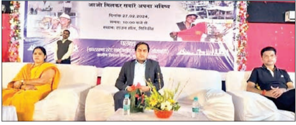
रोजगार मेले में उपस्थित डीडीसी व अन्य गणमान्य लोग।

आज सैकड़ों युवक-युवतियां अपने चेहरे पर मुस्कान लेकर लौटेंगीं। लेकिन, जैसे अभ्यर्थी जिनका किसी कारण चयन नहीं हो सका, वह निराश नहीं होंगे। पुनः रोजगार मेले का आयोजन किया जाएगा। जिला प्रशासन ज्यादा से ज्यादा युवाओं/युवतियों को रोजगार के अवसर उपलब्ध कराने को प्रयासरत है। वहीं, डीपीएम ने कहा कि जिले में तेजी से विकास हो रहा है। उन्होंने रोजगार मेले में शामिल सभी अभ्यर्थियों को शुभकामनाएं दीं। कहा कि निर्बंधित छात्र-छात्राओं का डाटा संग्रह करते हुए प्रशासन ज्यादा से ज्यादा रोजगार के अवसर मुहैया करायेगा। उन्होंने अभ्यर्थियों से निवेदनों द्वारा उपलब्ध कराए गए रोजगार के अवसर को गंभीरता से लेने को कहा। इस दौरान दीन दयाल