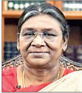
क्योंझर में नो-फ्लाईंग जॉन की घोषणा

बुधवार को विशेष विमान से बीजू पटनायक हवाई अड्डे पर पहुंचेंगी। प्रोटोकॉल के मुताबिक राज्यपाल, मुख्यमंत्री और अन्य गणमान्य लोग उनका स्वागत करेंगे। फिर एयरपोर्ट परिसर में गार्ड ऑफ ऑनर दिया जायेगा। वहां से राष्ट्रपति राजभवन जायेंगी। वह वायुसेना के विशेष हेलीकॉप्टर से मयूरभंज, ब्यांझर, ब्रह्मपुर, कटक और संबलपुर जायेंगी। राष्ट्रपति की सुरक्षा की निगरानी के लिए कमिश्नर पुलिस द्वारा 30 प्लाटून बलों के साथ 150 से अधिक अधिकारियों को तैनात किया गया है।