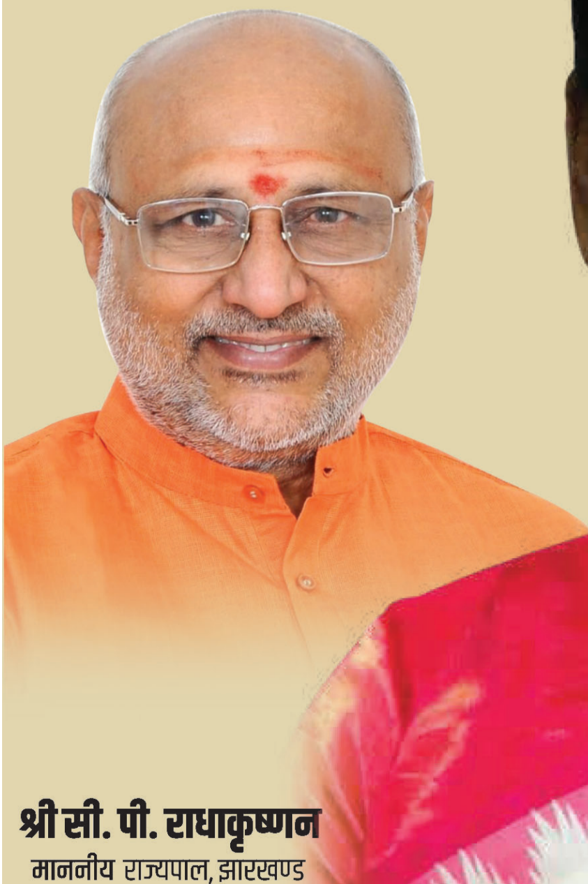
श्री सी. पी. राधाकृष्णन माननीय राज्यपाल, झारखण्ड