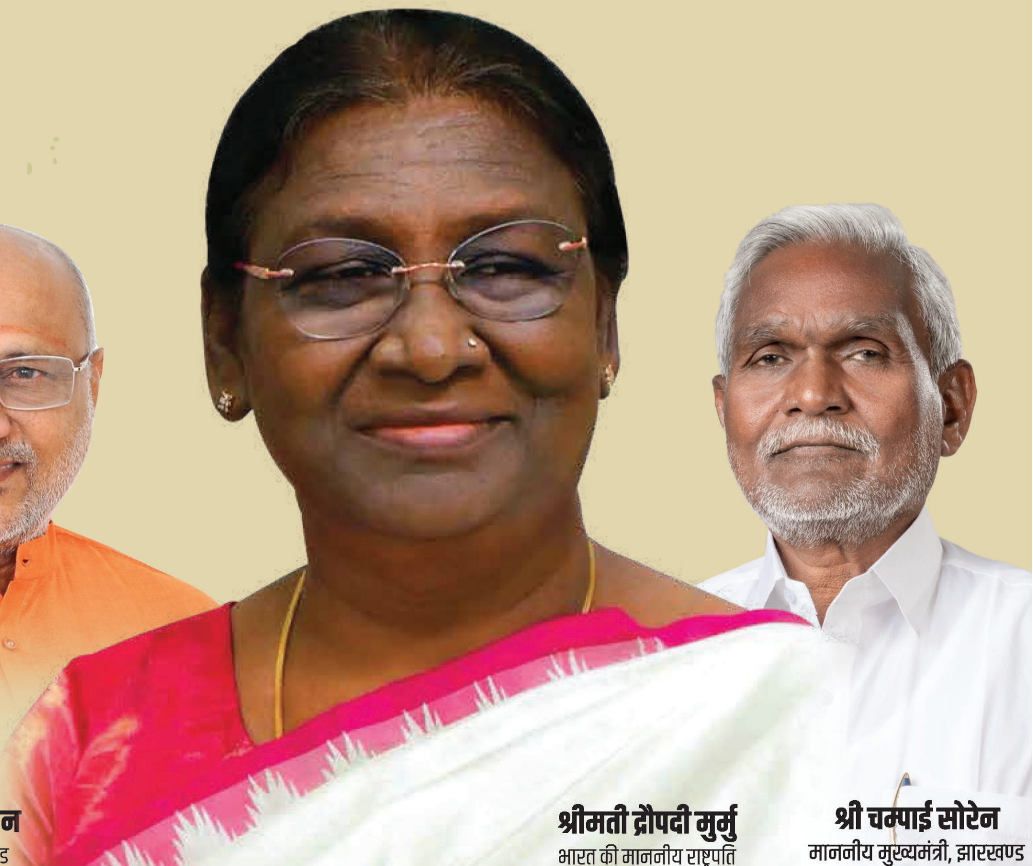
श्रीमती द्रौपदी मुर्मु भारत की माननीय राष्ट्रपति