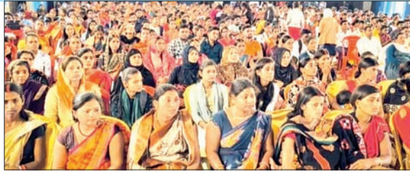
रोजगार मेले में विभिन्न जगहों से आए अभ्यर्थी

आज सैकड़ों युवक-युवतियां अपने चेहरे पर मुस्कान लेकर लौटेंगीं। लेकिन, जैसे अभ्यर्थी जिनका किसी कारण चयन नहीं हो सका, वह निराश नहीं होंगे। पुनः रोजगार मेले का आयोजन किया जाएगा। जिला प्रशासन ज्यादा से ज्यादा युवाओं/युवतियों को रोजगार के अवसर उपलब्ध कराने को प्रयासरत है। वहीं, डीपीएम ने कहा कि जिले में तेजी से विकास हो रहा है। उन्होंने रोजगार मेले में शामिल सभी अभ्यर्थियों को शुभकामनाएं दीं। कहा कि निर्बंधित छात्र-छात्राओं का डाटा संग्रह करते हुए प्रशासन ज्यादा से ज्यादा रोजगार के अवसर मुहैया करायेगा। उन्होंने अभ्यर्थियों से निवेदनों द्वारा उपलब्ध कराए गए रोजगार के अवसर को गंभीरता से लेने को कहा। इस दौरान दीन दयाल