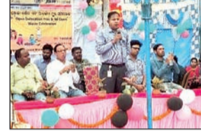
फाउंडेशन द्वारा किया गया था। समारोह में जेएसडब्ल्यू बीपीएसएल के सीएसआर प्रमुख, रंगेली ब्लॉक बीडीओ,

भुवनेश्वर। जेएसडब्ल्यू फाउंडेशन द्वारा संबलपुर के ठेककोलोई ग्राम पंचायत के अंतर्गत आने वाले धुबेनछापल गांव के गौतियोगड़ा और पाडलेपड़ा ने गांव के कल्याण के लिए खुले में शौच और कचरा मुक्त कार्यक्रम की गौरव यात्रा निकाली। इसका आयोजन ग्राम निग्रानी समिति, ग्राम जल स्वच्छता समितियां और