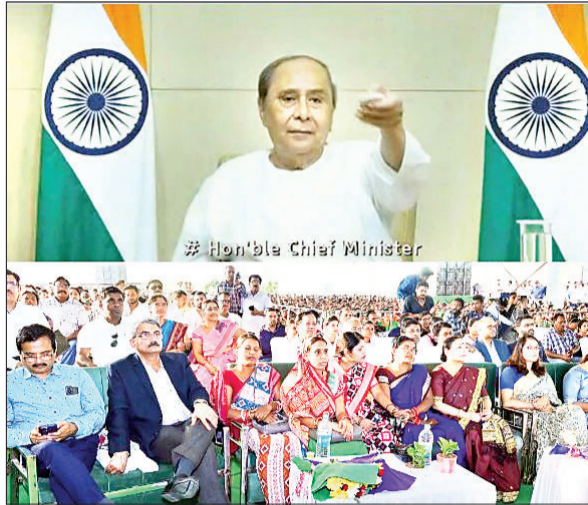
ओड़िशा प्रदेश में स्वास्थ्य सेवाओं को बेहतर करने के उद्देश्य से एमसीएल ने झारसुगुड़ा में निर्मित अत्याधुनिक एक सौ बिस्तरों का कार्डिएक केयर अस्पताल ओड़िशा सरकार को