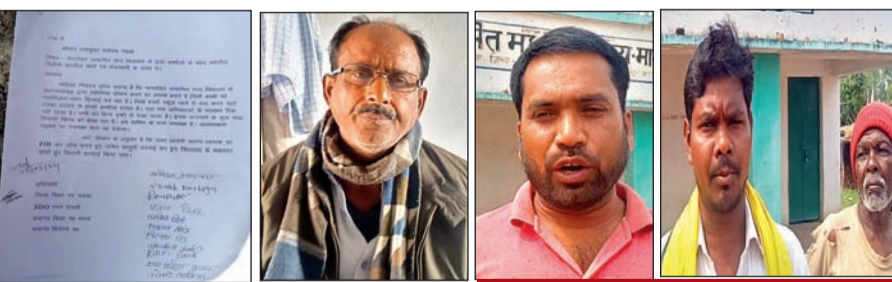
उपयुक्त को दिया गया आवेदन

सोशल मीडिया पर दो वीडियो हो रहा है वायरल जिससे अभिभावक नहीं ऐंठ रहे बच्चों को स्कूल अभिभावकों ने उपयुक्त को आवेदन देकर शिक्षक पर प्राथमिकी दर्ज कवने और बर्खास्त की अपील की