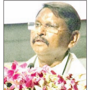
अब ध्यान पौषाणिक सुरक्षा पर है।

आजाद सिपाही संवाददाता नयी दिल्ली। भारतीय कृषि अनुसंधान परिषद (आईसीएआर) सोसायटी की 95वीं वार्षिक आम बैठक केन्द्रीय कृषि मंत्री अर्जुन मुंडा की अध्यक्षता में हुई। केन्द्रीय मंत्री श्री मुंडा ने कहा कि आईसीएआर ने देश को भूख-कुपोषण से निकालकर स्वस्थ कृषि उत्पादन की ओर ले जाने की दिशा में कृषि क्षेत्र में नवाचार का नेतृत्व किया है। पिछली बैठक में 46 से अधिक सुझाव आये थे, जिन सभी पर आईसीएआर ने कार्य पूर्ण किया है। श्री मुंडा ने कहा कि यह प्रधानमंत्री के कुशल नेतृत्व में केंद्र सरकार की उपलब्धि का ही नतीजा है कि विश्व में सर्वाधिक जनसंख्या होने के बावजूद भारत में 80 करोड़ से ज्यादा लोगों को केंद्र द्वारा मुफ्त अनाज दिया जा रहा है। आईसीएआर ने 2005 से 2014 के दौरान जहां अधिक पैदावार देने वाली 1,225 फसल किस्में जारी की थी, वहीं 2014 से 2023 के दौरान 2,279 ऐसी किस्में जारी की गयी है, जो लगभग दोगुना है।