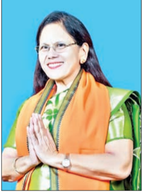
भाजपा कार्यकर्ताओं में खुशी की