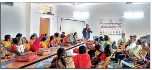
प्रशिक्षण प्राप्त करते पंचायत सहजकर्ता दल के सदस्य।

रंका। रंका प्रखंड सभागार में सबकी योजना सबका विकास (ग्राम पंचायत विकास योजना) अभियान 2024-25 अंतर्गत ग्राम पंचायत सहजकर्ता दल का तृतीय बैच का तीन दिवसीय प्रारंभ किया गया। यह प्रशिक्षण 22 फरवरी से लेकर 01 मार्च तक तीन बैच में चलेगा जिसमें पहला बैच में दूधवल, चुतूर, चुटिया, कटरा, विश्रामपुर, दूसरा बैच में मानपुर, खपरी, सोनदाग, तमगेकला, बाहाहारा, तीसरा बैच में सिरोंखुई, रंका कला, खरडिहा एवं कंचनपुर पंचायत सहजकर्ता दल का प्रशिक्षण दिया जाएगा। इस सहजकर्ता दल में पंचायत के सचिव, रोजगार सेवक, दो वार्ड सदस्य जिसमें एक महिला, जल सहीया, मुखिया द्वारा चिन्हित एक स्वयंसेवक, जेएसएलपीएस वीपीआरपी