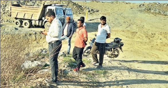
क्रशर को सील करने की प्रक्रिया पूरी करते अधिकारी।

- खनन नियमों का उल्लंघन करने पर की गई कार्रवाई - पिछले एक सप्ताह में अवैध खनन से जुड़े 10 वाहन जब्त - 5 लाख 72 हजार रुपए की वसूली की गई