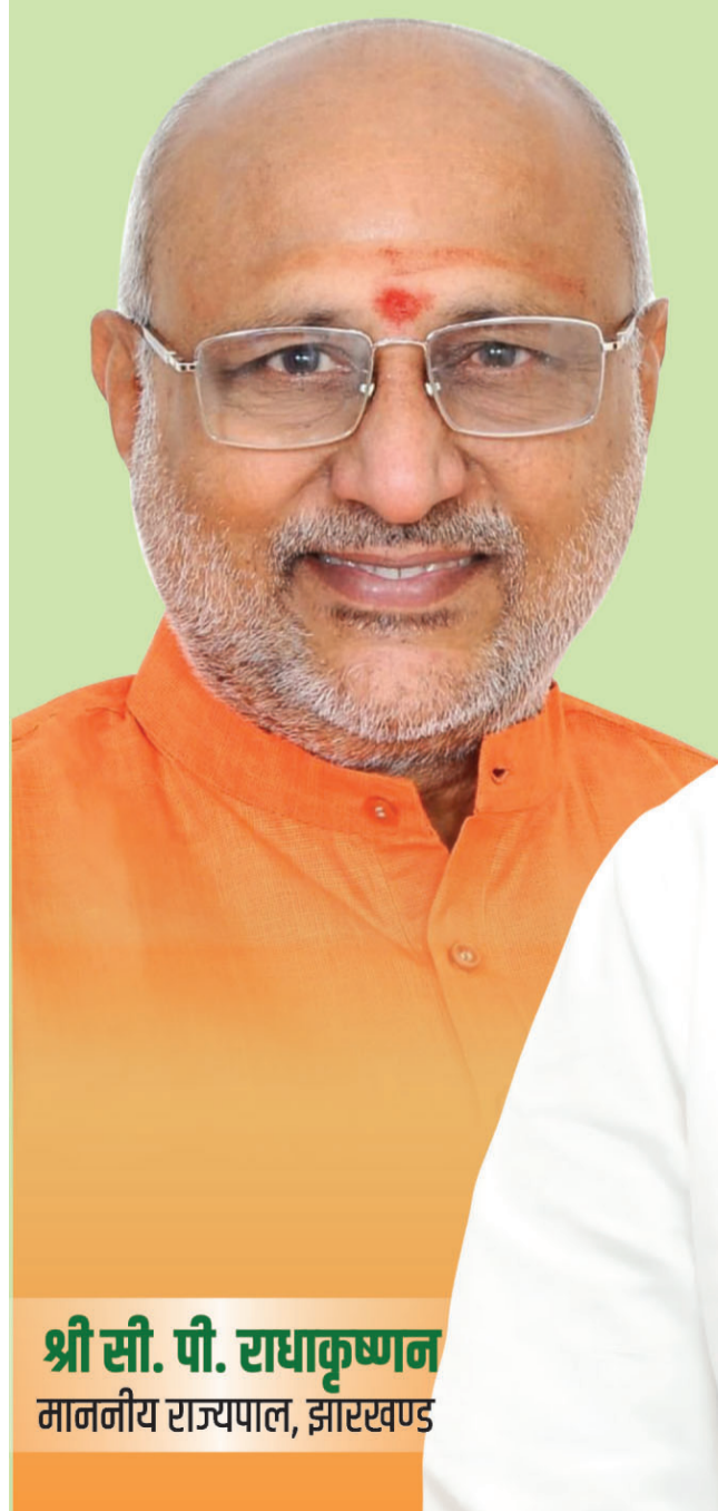
श्री सी. पी. राधाकृष्णन माननीय राज्यपाल, झारखण्ड