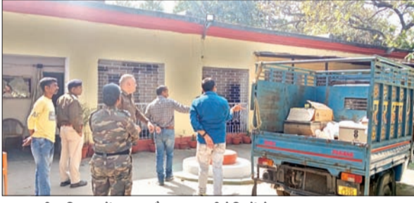
छापामारी अभियान में जब्त अवैध शराब की पेटियों से भरा वाहन।