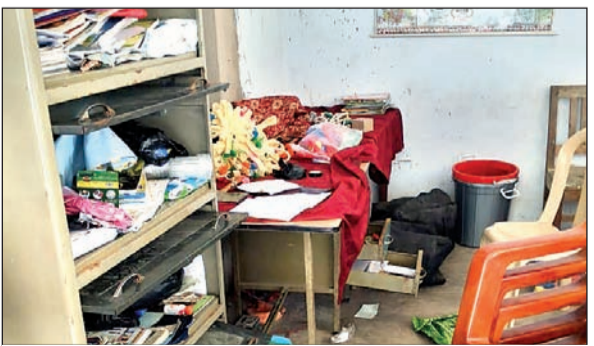
इसी आलमारी से की चोरी।

कांडी। प्रखंड अंतर्गत पहाड़ी इलाके के लोगों को एक यक्ष प्रश्न परेशान कर रहा है कि आखिर कैसे पढ़ें, इन 30-40 गांव के बच्चे बच्चियां। लगातार हो रही अपराधिक घटनाओं के कारण सुचारु रूप से पढ़ाई लिखायी असंभव हो गया है।