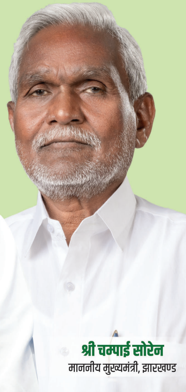
श्री चम्पाई सोरेन माननीय मुख्यमंत्री, झारखण्ड