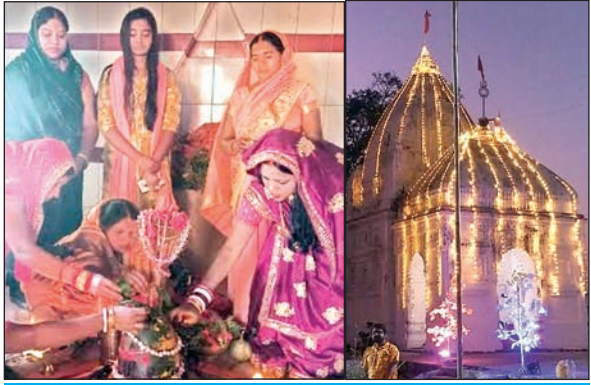
धूमधाम से मनी महाशिवरात्रि, निकली शिव बारात

अजाद सिपाही संवाददाता इचाक। महाशिवरात्रि के अवसर पर प्रखंड के विभिन्न शिवालयों में पूजा और रुद्राभिषेक के लिए दिनभर श्रद्धालुओं का जमावड़ा लगा रहा। इस दौरान महामालुंजय मंत्र और हर हर महादेव के जयकारे से पूरा क्षेत्र भक्तिमय रहा। प्रखंड के प्रसिद्ध बुढ़िया माता मन्दिर, बनासटांड शिवमंदिर, थानेश्वर मन्दिर, गुंजेश्वर धाम, बुढ़िया महादेव, इचाक मोड़, चपरख हदारी, करियातपुर, मोक्तेश्वर मन्दिर मोक्तमा, भूसाई शिवालय, भगवती मठ, मंगुरा, फुरुका, जेपी चौक दरिया, रतनपुर, देवकुली, लुंदरू समेत कई मंदिरों में पूजा अर्चना के पश्चात देर संध्या में महाभारती के बाद भोग भंडारा और प्रसाद रूपी खीर का वितरण किया गया। वहीं रात्रि को कीर्तन मंडलियों के द्वारा भक्ति जागरण किया गया। बताया जाता है कि इचाक में कई ऐसे शिवालय हैं जिसे सिद्ध मंदिर के रूप में जाना जाता है। मान्यता है कि वहां सच्चे मन से भजत मांगने वालों को मुग्धे पूरी होती है। वहीं भगवती मठ, थानेश्वर मंदिर, अरुणसिं शिवालय, बनस्टांड समेत कई अन्य मंदिरों में भी शिव मंदिर में पूजा समिति के द्वारा विशेष अयोजन किया गया।