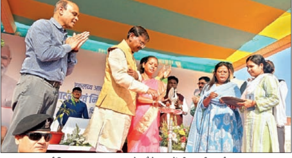
एकलव्य आदर्श विद्यालय का उद्घाटन के मौके पर केंद्रीय मंत्री अर्जुन मुंडा व अन्य।

खूंटी। केंद्रीय जनजातीय मामलों, कृषि एवं किसान कल्याण विभाग के मंत्री अर्जुन मुंडा ने कहा कि शिक्षा ही सबसे बड़ा धन है। इसी से सशक्त समाज और विकसित भारत का निर्माण हो सकता है। इसलिए प्रधानमंत्री नरेंद्र मोदी का प्रयास है कि जनजातीय क्षेत्रों में रहने वाले युवाओं को शिक्षित कर उन्हें तकनीकी ज्ञान से जोड़ा जाए, ताकि आनेवाले समय में वे विकसित भारत के निर्माण में योगदान दे सकें। केंद्रीय मंत्री सोमवार को करा में एकलव्य आदर्श विद्यालय के उद्घाटन और नियुक्ति पत्र वितरण समारोह को बतौर मुख्य अतिथि संबोधित कर रहे थे। उन्होंने कहा कि एकलव्य विद्यालय का उद्घाटन करना उनके लिए गौरव का क्षण है। आज का दिन हमारे बच्चों के लिए