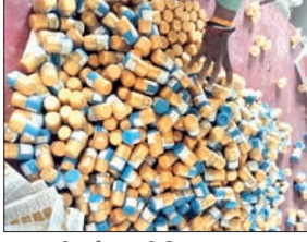
जब्त की गई नकली कीटनाशक दवा।