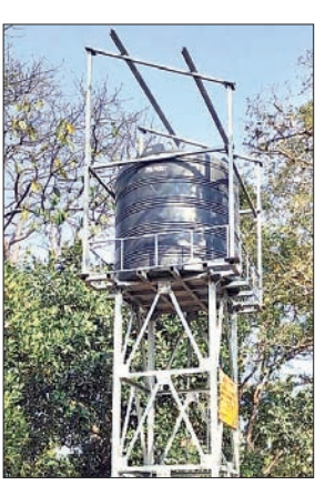
बेड़ो के टोंका टोली गांव में बिना सोलर व मशीन के बेकार पड़ा जलमीनार।

बेड़ो। केंद्र सरकार की महत्वाकांक्षी हर घर नल योजना बेड़ो में भ्रष्टाचार की भेंट चढ़ चुका है। विभागीय अधिकारी और संवेदक की साठगांठ के कारण यह योजना धरातल पर अपने उद्देश्यों को पूरा नहीं कर पा रहे है। कहीं बोरिंग करके छोड़ दिया गया है, तो कहीं जलमीनार बनाकर छोड़ दिया गया है। कहीं जलमीनार लगाया गया, तो उसमें पानी नहीं चढ़ता है तो कहीं कनेक्शन दे दिये गये, लेकिन आज तक पानी की आपूर्ति शुरू नहीं हुई। तो कहीं मानकों के अनुसार बोरिंग की गहराई नहीं की गयी। ऐसे कई मामले हैं। जिसकी शिकायत ग्रामीणों द्वारा मिलने के बाद भी जिम्मेदार मौन हैं। प्रखंड के दिव्या पंचायत के टोंका टोल में एक वर्ष से बोरिंग व जलमीनार तैयार है, लेकिन एक