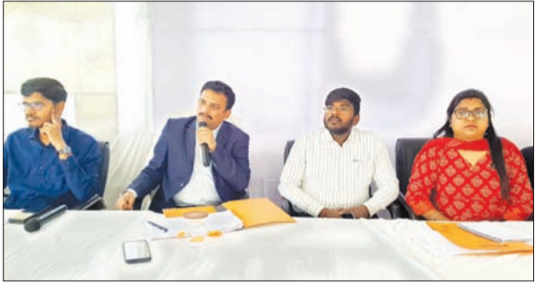
अधिकारियों के साथ समीक्षा बैठक करते डीसी शशि रंजन।

आजाद सिपाही संवाददाता मेदिनीनगर। जिला निर्वाचन पदाधिकारी सह डीसी शशि रंजन ने मंगलवार को समाहरणालय सभागार में निर्वाचक निबंधन पदाधिकारी, सहायक निर्वाचक निबंधन पदाधिकारी, सभी बीएलओ सुपरवाइजर के साथ बैठक कर लोकसभा चुनाव की तैयारियों की समीक्षा की। उन्होंने 18-19 आयुवर्ग के मतदाताओं का निबंधन, एएसडी वोटर जांच, वरिष्ठ मतदाताओं की जांच, ईपी जेंडर रेश्यो आदि जांच की समीक्षा कर महत्वपूर्ण निर्देश दिये। उन्होंने एएसडी (अनुपस्थित, स्थानांतरित या मृत) वोटरों की सूची तैयार