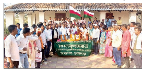
भारत मुंडा समाज की सभा में उपस्थित लोग।