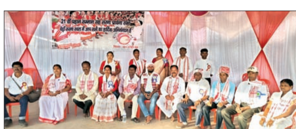
पहाण सम्मान समारोह में मौजूद अतिथि।

बेड़ो। महादानी मैदान में मंगलवार को बेड़ो सरना समिति के तत्वावधान में 21वां वार्षिक पहाण सम्मान सह सरना प्रार्थना सभा समारोह का आयोजन किया गया। जिसमें सरना धर्मावलंबी पारंपरिक वेशभूषा में शामिल हुए। कार्यक्रम का शुभारंभ पूजा अर्चना और धार्मिक गान के साथ हुई। कार्यक्रम में सामाजिक, पारम्परिक सांस्कृतिक रीति रिवाज को अक्षुण्ण बनाये रखने पर चर्चा की गयी।