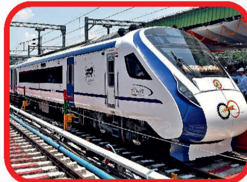
रांची-पटना, रांची-हावड़ा व रांची-वाराणसी, वंदे भारत एक्सप्रेस