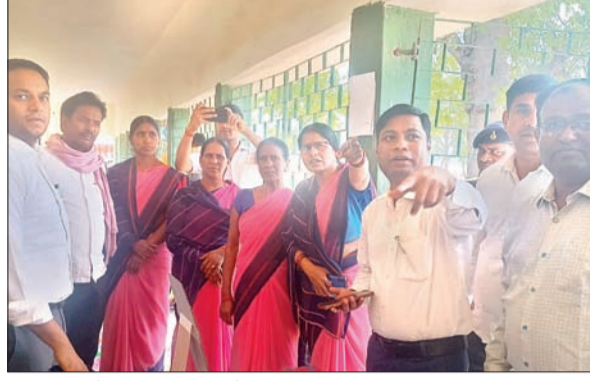
मतदान करने का मॉकड्रिल करते काल्पनिक मतदाता-अधिकारी।

मेदिनीनगर। लोकसभा चुनाव में पलामू जिले में 80 फीसदी से अधिक मतदान कराना सुनिश्चित करने को लेकर स्वीप अंतर्गत कई गतिविधियां संचालित की जा रही हैं। इसी क्रम में पांकी विधानसभा अंतर्गत लेखलीगंज, तरहसी व पांकी के पांच बूथों पर शुक्रवार को काल्पनिक मतदान कराया गया। यहां बूथ पर प्रीजाडिंग ऑफिसर के रूप में फ्यूचर वोटर को तैनात किया गया था। उन सभी ने बूथों पर मतदान करने आये स्थानीय वोटर का नाम मतदाता सूची से मिलान किया। इसके बाद संबंधित मतदाता के उंगली पर