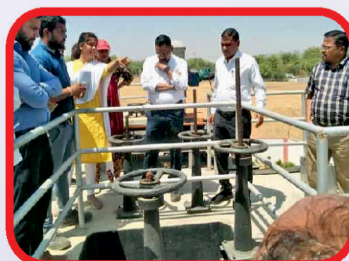
302 करोड़ रुपये की लागत से बने वाटर ट्रीटमेंट प्लांट का जायजा लेते सांसद