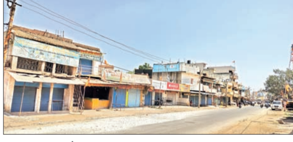
बंद दुकान-बाजार, परसा हुआ सन्नाटा।