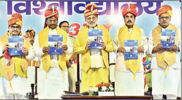
युवाओं को सशक्त बनाने में यूनिवर्सिटी का बड़ा रोल: राज्यपाल

रांची (आजाद सिपाही)। रांची विश्वविद्यालय के दीक्षांत समारोह में शुक्रवार को मोरहाबादी परिसर स्थित दीक्षांत मंडप में 4043 को उपाधि दी गयी। साथ ही 76 विद्यार्थियों को गोल्ड मेडल मिला। इनमें 40 छात्राएं और 21 छात्र शामिल रहे। उपाधि और गोल्ड मेडल पाकर विद्यार्थियों के चेहरे खिलखिला उठे। समारोह में मुख्य अतिथि राज्यपाल सह कुलाधिपति सीपी राधाकृष्णन और केंद्रीय मंत्री अर्जुन मुंडा मौजूद रहे। इन्होंने पारंपरिक परिधान में उपस्थित छात्र-छात्राओं को गोल्ड मेडल और उपाधि प्रदान की।