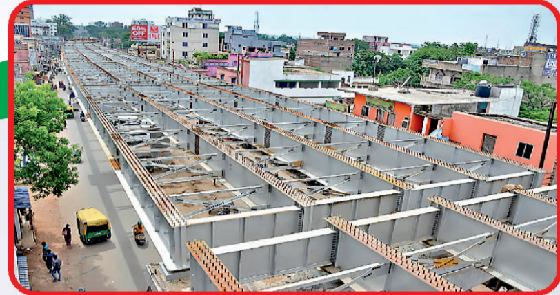
विकास की गाथा