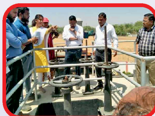
302 करोड़ रुपये की लागत से बने वाटर ट्रीटमेंट प्लांट का जायजा लेते सांसद