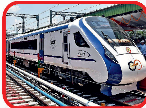
रांची-पटना, रांची-हावड़ा व रांची-वाराणसी, वंदे भारत एक्सप्रेस