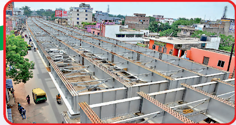
विकास की गाथा