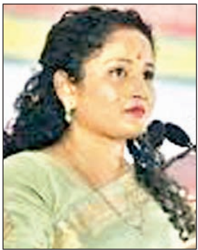
अधिक हो गये हैं।

रांची। झारखंड के पूर्व मुख्यमंत्री हेमंत सोरेन पिछले डेढ़ महीने से जमीन घोटाले को लेकर जेल में बंद हैं। इस दौरान वह जेल में बंद कैदियों और वहां तैनात महिला सिपाहियों की समस्याओं से रूबरू हो रहे हैं। उन्होंने उनकी सहायता के लिए सरकार से अनुरोध भी किया है। जेल में रहने के दौरान हेमंत सोरेन की चिंताओं को लेकर कल्पना सोरेन ने सोशल मीडिया प्लेटफॉर्म एक्स पर लिखा है कि हेमंत जी को अन्यायपूर्ण कारावास में रहते हुए 45 दिन से