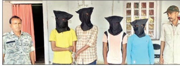
साइबर ठगों को गिरफ्तार कर ले जाती पुलिस।