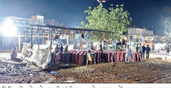
समिति की ओर से सब्जी मंडी व पूरे बाजार में जगह-जगह लाइट

बेड़ी। रांची-गुमला मुख्य मार्ग पर स्थित झारखंड की प्रसिद्ध सब्जी मंडी व सोमवार, गुरुवार और शनिवार को लगने वाली साप्ताहिक बाजार में लाइट नहीं रहने की खबर को आजाद सिपाही अखबार ने रविवार को प्रमुखता से प्रकाशित किया था। खबर छपने के बाद मंगलवार को बाजार