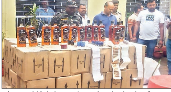
अवैध शराब की पेटियों की जांच करते उत्पाद विभाग के अधिकारी-कर्म।