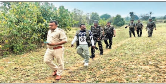
सीरम जंगल में सर्च अभियान चलाती पुलिस।