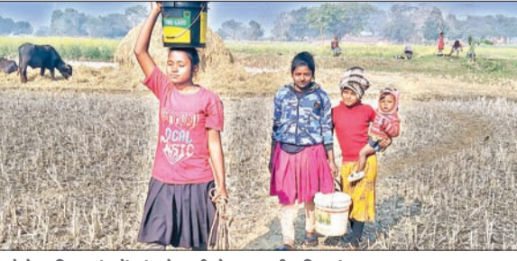
बेड़ो के चरिया गांव में कुएं से पानी लेकर आती बच्चियां।

बेड़ी। प्रखंड मुख्यालय सहित ग्रामीण क्षेत्रों में पेयजल को लेकर गांव-मुहल्ले में बोरिंग व जलमिनार, हर घर में नल भी लगा हुआ है फिर भी लोगों के हलक सूख रहे हैं। जलापूर्ति के नाम पर योजनाएं ठप पड़ी हैं। पेयजल को लेकर कागजों में सब सरपट दौड़ रहा है, लेकिन धरातल पर योजनाएं पानी मांग रही हैं। प्रखंड के 17 पंचायत के 84 गांवों में पानी के नाम पर संचालित योजनाएं दम तोड़ रही हैं। हाल यह है कि 14वीं-15वीं वित्त से बनी नल जल योजना के बाद भी ग्रामीण पानी के लिए तरस रहे हैं। जबकि सरकार की महत्वकांक्षी योजनाओं में से एक नल जल योजना के जरिए सरकार ग्रामीण क्षेत्र के घर-घर में नल से पहुंचाने की कोशिश में है। लेकिन सरकार की इस योजना पर जिम्मेदार लापरवाही कर पत्नीता लगाते नजर आ रहे हैं। जिस कारण सरकार