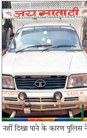
नहीं दिखा पाने के कारण पुलिस ने

गिरिडीह। एसपी को मिली गुप्त सूचना के आधार पर अनुमंडल पुलिस पदाधिकारी बगोदर सरिया के नेतृत्व में छापामारी टीम ने शनिवार की सुबह सात बजे सरिया-धनवार मुख्य सड़क पर पंद्रा खुर्द ग्राम के नजदीक औचक वाहन जांच अभियान चलाया। इस दौरान एक पिकअप वाहन को रोका गया, जिसमें करीब चार टन अवैध कच्चा कोयला लगा था। सटीक दस्तावेज नहीं दिखा पाने के कारण पुलिस ने