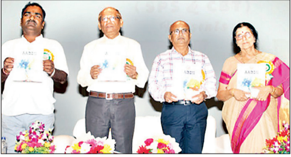
फार्मासिस्टों के लिए उत्पन्न होने वाले अवसरों को देखने के लिए कहा। उन्होंने छात्रों को सलाह दी कि उन्हें समाज के हित के लिए