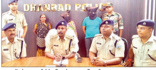
प्रकारों को जानकारी देते पुलिस के आला अधिकारी।