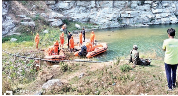
शव की तलाश करती एनडीआरएफ की टीम।