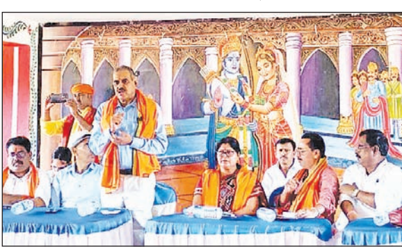
रविवार को डोरंडा स्थित दुर्गा मंडप परिसर में धनवार विधानसभा स्तरीय कार्यक्रम को संबोधित करते भाजपा नेता सह पूर्व आइजी लक्ष्मण प्रसाद सिंह।

आजाद सिपाही संवाददाता राजधननगर (गिरिडीह)। आपको मोदी सरकार द्वारा किये गये कार्यों को जन जन तक पहुंचाना है और उन्हें भाजपा को वोट करने के लिए प्रेरित करना है, ताकि इस बार के चुनाव में पिछले सभी रिकॉर्ड टूट जाये। उक्त बातें बतौर मुख्य अतिथि भाजपा विधायक नीरा यादव ने कहीं। वे डोरंडा स्थित दुर्गा मंडप परिसर में धनवार विधानसभा स्तरीय कार्यक्रम में उपस्थित भाजपा कार्यकर्ताओं को संबोधित कर रहे थीं। विधायक ने मोदी सरकार के कार्यकाल में किए गए विकास कार्यों की चर्चा करते हुए कहा कि उन सभी विकास योजनाओं के बारे में मतदाताओं को जानकारी दें। कहा कि नए मतदाताओं को भी भाजपा के कार्यों के बारे में बताते हुए उन्हें पहला वोट कमल फूल में डालने के लिए प्रेरित करें। कार्यक्रम को संबोधित करते हुए भाजपा नेता सह पूर्व आइजी लक्ष्मण प्रसाद सिंह ने कहा कि