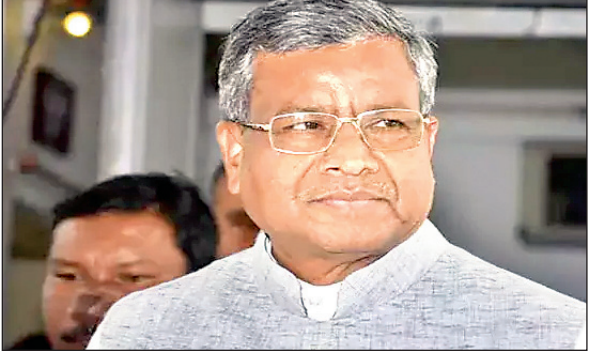
महाभारत की परिस्थितिवश मजबूरी में मुख्यमंत्री बनाये जाने सोरेन परिवार की अनुकंपा पर के बाद इनके हाथों की

रांची। भाजपा प्रदेश अध्यक्ष एवं पूर्व मुख्यमंत्री बाबूलाल मरांडी ने रविवार को एक्स पर पोस्ट के माध्यम से राज्य के मुख्यमंत्री चंपाई सोरेन पर निशाना साधा। श्री मरांडी ने कहा कि चंपाई सोरेन जी, इंडी टगबंधन की रेली लोकतंत्र बचाने की नहीं, बल्कि परिवारवाद, भ्रष्ट तंत्र और भ्रष्टाचारियों को बचाने की मुहिम है। कहा कि अफसोस है कि चंपाई सोरेन पारिवारिक अंदरूनी