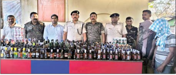
पुलिस की छापा मारी में बरामद विदेशी शराब व बियर की बोटलें।