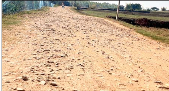
बोदा गांव में बनी जर्जर पीएमजीएसवाई की सड़क।

बेड़ो। सरकार की महत्वाकांक्षी योजना प्रधानमंत्री ग्राम सड़क योजना को भ्रष्टाचार का दीमक अंदर ही अंदर खोखला कर रहा है। पूरे प्रखंड में इस योजना के तहत बनाई गई सड़कें भ्रष्टाचार की भेंट चढ़ गई हैं। कुछ महीने पहले तक बनी सड़कें जर्जर हो गई हैं। जबकि सरकार द्वारा करोड़ों रुपये की लागत से सड़क का निर्माण किया जा रहा है जिसमें नियम-कायदे ताक पर रखे जा रहे हैं। प्रति वर्ष नई पक्की सड़क और पुराने जर्जर सड़कों के निर्माण के लिए सरकार द्वारा विभाग को करोड़ों रुपये की राशि आवंटित की जाती है। लेकिन ठेकेदार और अधिकारी मिलकर सड़क का