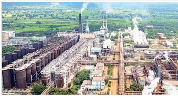
जाने के लिए चल रहे विस्तार का एक हिस्सा है।

भुवनेश्वर। भारत के सबसे बड़े एल्युमीनियम उत्पादक वेदांता एल्युमीनियम ने आज 3 मिलियन टन प्रति वर्ष (एमटीपीए) एल्युमीनियम उत्पादन क्षमता के साथ शीर्ष 3 वैश्विक खिलाड़ियों में शामिल होने के अपने चल रहे विस्तार प्रयासों में एक बड़ी उपलब्धि की घोषणा की। 100% वर्टिकल इंटीग्रेशन हासिल करने की दिशा में एक महत्वपूर्ण कदम में, कंपनी ने आज ओड़िशा के लांजीगढ़ में अपनी विश्व स्तरीय एल्युमीना रिफाइनिंग में नये 1.5 एमटीपीए विस्तार के सफल कमीशन की घोषणा की। इसके साथ, एल्युमीना रिफाइनिंग की उत्पादन क्षमता अब मौजूदा 2 एमटीपीए से बढ़कर 3.5 एमटीपीए हो गयी है। यह अतिरिक्त 1.5 एमटीपीए क्षमता कंपनी के बढ़ते एल्युमीनियम उत्पादन का समर्थन करने के लिए लांजीगढ़ रिफाइनिंग में कुल नेमप्लेट क्षमता को वर्तमान 2 एमटीपीए से 5 एमटीपीए तक ले