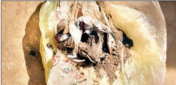
शमशाण घाट से उठाकर लायी गयी मिट्टी