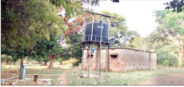
बेड़ो के सुभर दोन में बंद पड़ा जलमीनार।

बेड़ो। गांव के लोगों को शुद्ध पेयजल उपलब्ध कराने के लिए सरकार की ओर से लाखों रुपये खर्च किए गए, लेकिन टूट बनी टकियां बता रही हैं कि लाखों रुपये पानी में बह गए पर लोगों को पानी मयस्सर नहीं हुआ। गांव के लोग पहले की ही तरह पेयजल की किल्लत से जूझ रहे हैं। सरकार की महत्वाकांक्षी योजना हर घर नल जल योजना के बाद भी पानी के लिए लोग भटकने को मजबूर हैं। विभाग द्वारा फाड़लों में योजना को शत-प्रतिशत पूरा करने का दावा किया गया है, लेकिन जमीन पर इसकी हालत काफी बर्दाहल है। कहीं जलमीनार पर पानी की सूखी टंकी बहाली की कहानी कह रही है तो कहीं