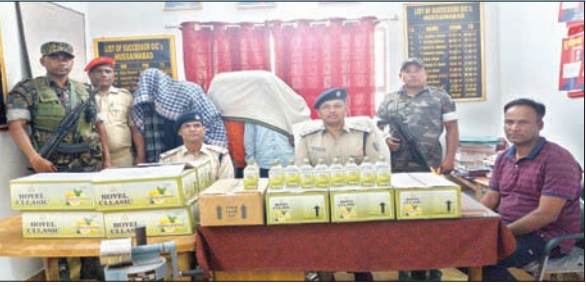
प्रेस वार्ता कर आरोपितों की जानकारी देते पुलिस के आला अधिकारी।