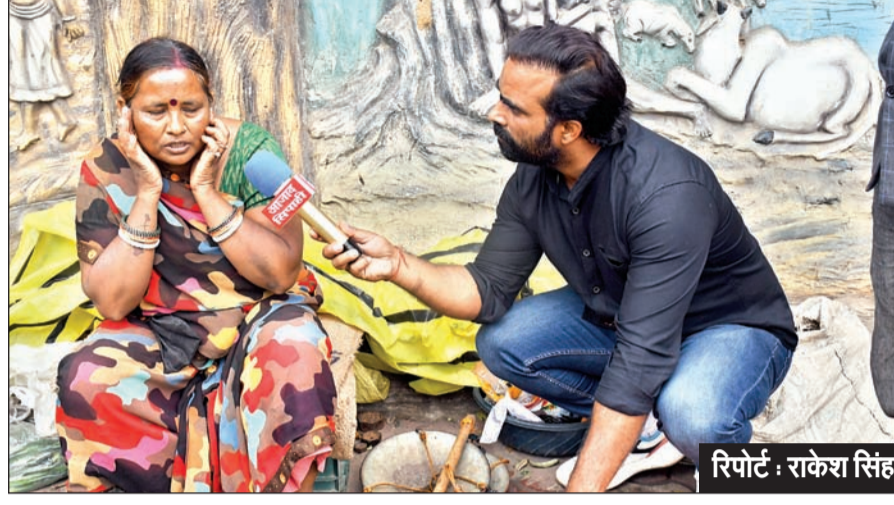
रिपोर्ट : राकेश सिंह

हजारीबाग लोकसभा क्षेत्र में 20 मई को वोटिंग होगी है। चुनाव आते-जाते रहते हैं, लेकिन जनता वहां रह जाती है। जिस उम्मीद के साथ जनता वोट देती है, प्रतिनिधि चुनती है, वह कभी पूरी नहीं होती। लोगों ने कहा कि हजारीबाग अभी बहुत से क्षेत्र में पिछड़ा हुआ है। यहां आज तक एयरपोर्ट नहीं बन पाया है। ट्रैफिक व्यवस्था चरमरायी हुई है। प्रशासन भी शहर में घुसना नहीं चाहता। सड़क का चौड़ीकरण नहीं हुआ है। प्रशासन के अधिकारी भी राजनेता की तरह आशवासन देकर निकल जाते हैं। विस्थापन भी बड़ी समस्या है। बगोदर, विष्णुगढ़, बरकड़ा, कटकमसांडी और बड़कागांव में विस्थापन और पलायन का दर्द लोग झेल रहे हैं। हजारीबाग में कोई बड़ा उद्योग नहीं है। रेलवे स्टेशन और मेडिकल कॉलेज छोड़ कर ऐसा इस क्षेत्र में कुछ नहीं है, जिसे आप विकास कह