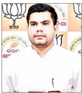
थी कि बीजू जनता दल की राजनीति में सोधे तौर पर शामिल