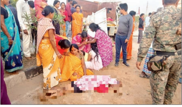
हादसे के बाद रोते-बिलखते परिजन।

रातू राजधानी रांची में लोक आस्था के पर्व चैत छठ पर हुए सड़क हादसे में तीन लोगों की मौत हो गयी। यह हादसा रातू थाना क्षेत्र के काठीटांड के शिव मंदिर के पास हुआ। सभी लोग भगवान भास्कर को सोमवार की सुबह का अर्घ्य देने जा रहे थे। प्रत्यक्षदर्शियों के अनुसार अर्घ्य देने जा रहे लोगों से भरी एक ऑटो डिवाइडर से टकराकर दुर्घटनाग्रस्त हो गयी। इस हादसे में तीन लोगों की मौत हो गयी। मृतकों में दो महिला और एक 10 साल की बच्ची शामिल है। जबकि नौ अन्य लोग घायल हैं।