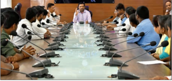
कैम्पस अंबेसडरों के साथ बैठक करते जिला निर्वाचन पदाधिकारी शशि रंजन।

पलामू में मतदाता सूची में नाम जुड़वाने का आज अंतिम दिन, फॉर्म 6 भरकर अपने वीएलओ या वीएचए के माध्यम से आवेदन करें : डीसी