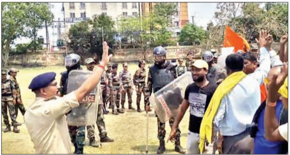
पुलिस लाइन में माँक डील करती धनबाद पुलिस।

धनबाद। रामनवमी पर जिले भर में अखाड़ा निकाला जाता है। अखाड़ा दल पारंपरिक शस्त्रों के साथ प्रदर्शन करते हैं। ऐसे में सुरक्षा और ऐतिहासिक महत्त्व के धनबाद पुलिस की मुकम्मल तैयारी है। सोमवार को पुलिस लाइन में रामनवमी के महानजर धनबाद पुलिस ने माँक डील किया। जिसमें दंगा रोधी उपकरणों की जांच और अभ्यास किया गया। इसी के साथ आसू गैस के गोले और वाटर केनन का भी अभ्यास किया गया। डीएसपी मुख्यालय 1