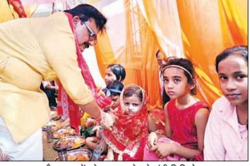
नौ कन्याओं को प्रसाद परोसते मंत्री मिथिलेश