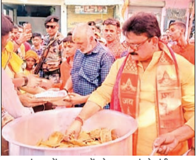
भंडारा में श्रद्धालुओं को प्रसाद बांटते मंत्री