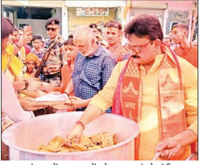
भंडारा में श्रद्धालुओं को प्रसाद बांटते मंत्री

रामनवमी के मौके पर हुआ कई जगहों पर भंडारा का आयोजन