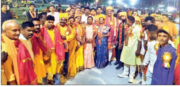
रामनवमी के जुलूस में शामिल हुए सांसद संजय सेठ।