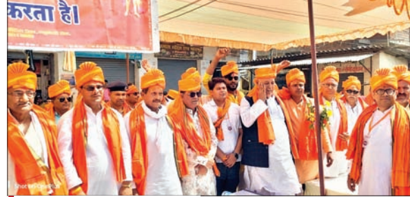
-रेहला में निकला रामनवमी का भव्य जुलूस - राम रथ व राम दरवार की झांकी रहा आकर्षण का केंद्र आजाद सिपाही संवाददाता

मेदिनीनगर। रेहला में बुधवार को रामनवमी का भव्य जुलूस निकाला गया। जिसमें दर्जनों गांवों के राम भक्तों का शैलाव उमड़ पड़ा। पहली बार भगवा वस्त्र में बड़ी संख्या में महिलाएं भी शामिल हुईं। हनुमान मंदिर में पूजा-अर्चना के बाद रामनवमी का जुलूस महावीर