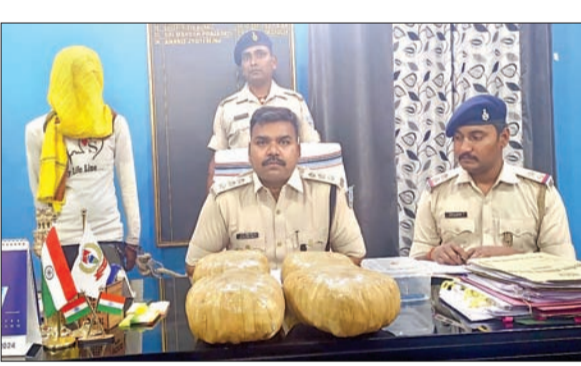
पकड़े गए गांजा तस्कर की जानकारी देते पुलिस के आला अधिकारी।