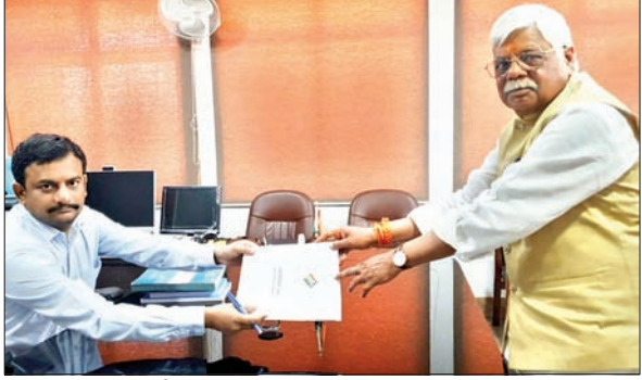
आजाद सिपाही संवाददाता

■ नामांकन कार्यक्रम में जुटे पार्टी के वरिष्ठ नेता ■ भाजपा ने रैली और सभा कर उम्मीदवार को वोट देने की अपील की