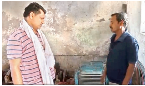
पंप हाउस का जायजा लेते पूर्व वार्ड पार्षद।