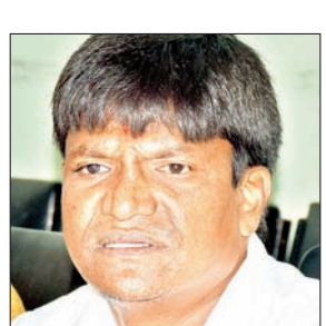
अंचल कार्यालय धनबाद के