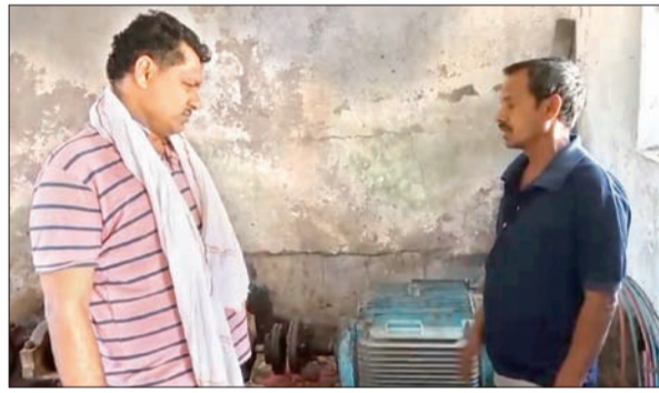
पंप हाउस का जायजा लेते पूर्व वार्ड पार्षद।