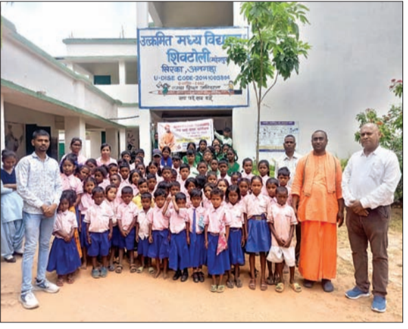
नेत्र जांच शिविर में उपस्थित बच्चे।

अनगड़ा। रांची के मोराबादी रामकृष्ण मिशन आश्रम की ओर से संचालित गदाधर अभ्युदय प्रकल्प महेशपुर एवं उल्कमित मध्य विद्यालय शिव टोली में बुधवार को नेत्र जांच शिविर का आयोजन किया गया। नरेन आई केयर कार्यक्रम के तहत आयोजित इस शिविर में नेत्र चिकित्सकों द्वारा बच्चों के आंखों की जांच की गई और उनके बीच दवा का भी वितरण किया गया। शिविर में कुल 61 बच्चों के आंखों की जांच की गई। साथ ही बच्चों को आंखों की साफ सफाई पर विशेष ध्यान देने के अलावा समय-समय पर होने वाले संक्रमण से बचाव आदि के