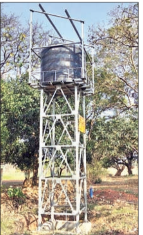
पानी पर आश्रित हो गये हैं।

बेड़ो। प्रखंड के दिधिया पंचायत के तुको गांव में डेढ़ साल बाद भी बोरिंग नहीं हो पाया और टोंका टोली में एक वर्ष से बोरिंग व जलमीनार तैयार है, लेकिन एक वर्ष बाद भी सोलर व मशीन नहीं लग पाया है। जिसके कारण इस प्रखंड गर्मी में पीने के पानी के लिए दोनों जगह हाथ-तौबा मची हुई है। ऐसा नहीं है कि पंचायत के विकास मंदा में पेयजल की समस्या को लेकर कोई काम नहीं किया गया है। सभी पंचायतों में 14वें व 15वें वित्त आवेग की राशि से लाखों की लागत में पेयजल के लिए सोलर जलमीनार लगाया गया है, पर जलमीनार कम गुणवत्ता का होने के कारण एक वर्ष भी सही तरह से चल नहीं पाई। वहीं, वर्तमान में नल जल योजना की जलमीनार का काम गांव की शोभा बढ़ाने के अलावा कुछ नहीं है। लोग खेत में बने कुआं का गंद