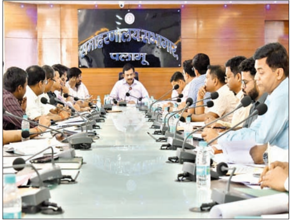
फॉर्म में जमा कराने को कहा।

मेदिनीनगर। पलामू लोकसभा चुनाव में शत-प्रतिशत मतदान सुनिश्चित करने के उद्देश्य से शनिवार को जिला निर्वाचन पदाधिकारी सह डीसी शशि रंजन की अध्यक्षता में अब्सेंटी वोटर्स को पोस्टल बैलेट से मतदान कराने को लेकर समाहरणालय कक्ष में बैठक हुई। जिसमें डीसी ने पोस्टल बैलेट के माध्यम से होने वाले मतदान को लेकर निर्वाचन आयोग द्वारा जारी दिशा-निर्देशों के तहत जिले में अबतक की तैयारियों की समीक्षा कर कई महत्वपूर्ण निर्देश दिए। साथ ही एसेंशियल सर्विसेज की श्रेणी में आने वाले विभिन्न विभागों के अधिकारियों एवं कर्मियों का मतदान लोकसभा चुनाव 2024 में सुनिश्चित कराने को लेकर सभी संबंधितों को निर्देशित किया। उन्होंने सभी एसेंशियल सर्विसेज के नोडल पदाधिकारियों से सभी योग्य मतदाता का नाम निर्धारित 12 डी