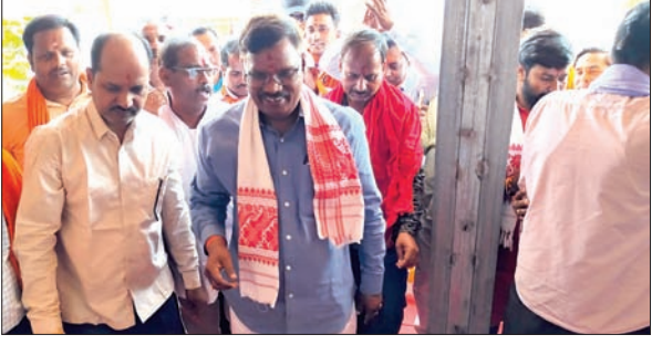
भाजपा के चुनावी कार्यालय के उद्घाटन के मौके पर पार्टी के वरिष्ठ नेतागण।

भाजपा ही एक ऐसी पार्टी है, जो बूथ स्तर पर संगठित कमेटी के आधार पर चुनाव लड़ती है। कार्यकर्ता का संपर्क मतदाता से सीधा रहता है। भाजपा प्रथम चरण के चुनाव में बहुत आगे चल रही