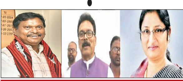
पहले और दूसरे चरण के चर्चित प्रत्याशी

आजाद सिपाही संवाददाता रांची। झारखंड में 13 मई से चार चरणों में लोकसभा चुनाव होनेवाला है। पहले और दूसरे चरण के लिए प्रत्याशियों ने नामांकन भी कर लिया है। राज्य की 14 में से सात सीटों पर चुनावी योद्धा मैदान में उतर चुके हैं। इन योद्धाओं में कोई करोड़पति तो कोई लखपति है, जो जनता के बीच हाथ जोड़े खड़ा है। झारखंड के पहले चरण के चुनाव में खूंटी, सिंहभूम, पलामू और लोहरदगा में चुनाव होने हैं। इसमें 45 योद्धा मैदान में हैं। इसमें करीब एक दर्जन करोड़पति हैं। नामांकन में दाखिल एफिडेविट में किसी ने पति के नाम पर संपत्ति दिखायी है, तो किसी ने पत्नी के नाम पर। ज्वेलरी से लेकर जमीन, जायदाद और बैंक खाते में जमा राशि भी इसी तरह से दर्शाया है। रिपोर्ट क्या कहता है : एडीआर और द नेशनल इलेक्शन वॉच ने 45 उम्मीदवारों के शपथ पत्र का विश्लेषण कर एक रिपोर्ट जारी की। रिपोर्ट में उम्मीदवारों की संपत्ति